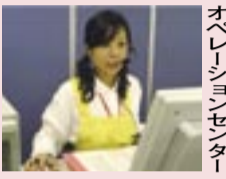
オペレーションセンター

要介護者に対して、夜間(午後10時～午前7時)に定期的、または利用者の求めに応じてホームヘルパーが自宅を訪問し、入浴・排せつ・食事等の介護や日常生活の世話をします。※自宅に専用のケアコール端末(工事はかかりません)を設置します。ケアコールを押すだけでオペレーションセンターの看護師が対応します。介護サービスが必要な時には、ヘルパーが自宅に駆け付け、介護サービスを提供します。