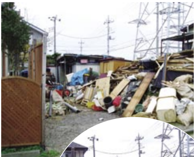
パトロールで見えられた野積み

「野積み」とは、建物解体した廃材や古タイヤ、事業者から出たごみや一般家庭から出たごみなどの「廃棄物等」を重点的にパトロール別せずに多量に屋外にたし、たい積されている種別を調査し監視を続けています。その結果、市内にあった小規模な野積み一カ所が市の指導のもと地権者により撤去される(写真)などたし積量は少しずつ減少しています。また、大規模な野積み一カ所については、土地所有者十一人と十の事業者に対して、条例内