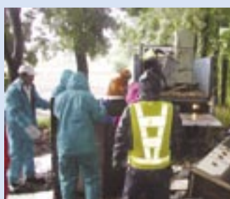
地権者とともに一掃作戦