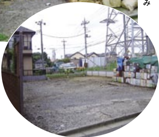
指導により処分した野積み