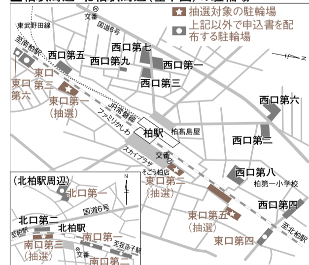
■柏駅周辺・北柏駅周辺(左下図)の駐輪場

◎当選して利用許可申請手続きをしなかったかたは、来年度の抽選申し込みの資格がなくなります