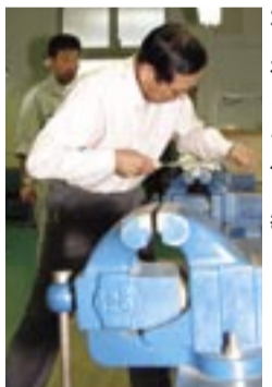
自らが熟練の職人。金型技術の基 本を社員に直伝で教える

クがあるから今の自分がある」と力を込める。「ものづくりが大切という議論は多く聞くが、本当にその精神が伝承されているだろうか。ともするとコスト優先的な経営が主体になっていないだろうか」。今こそ社員との信頼、連係、地域とのかかわりが技術の伝承においても何より大切、と語る。ちなみに社員はすべて正社員で、技術で勝ち抜こうという意欲が溢れている。経営理念との問いには、「夢を持ち、夢をかなえ、夢に挑戦するものづくり集団でありたい」。自らの技とものづくりを楽しむ姿勢、そして人とのつながりに裏付けられた確かな技術で、世界へ通用する製品開発へ向けて挑戦を続ける。