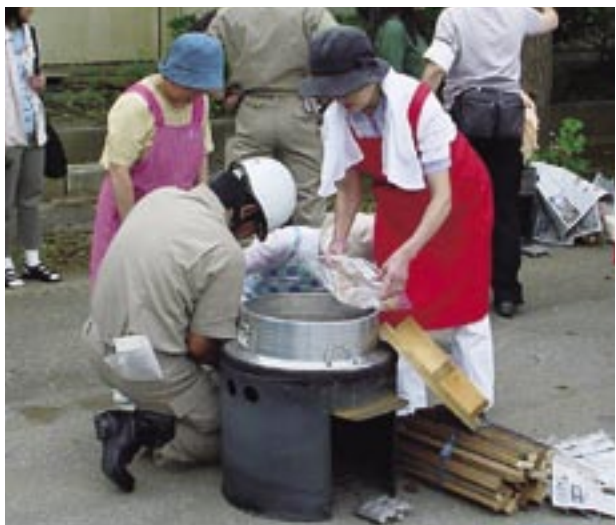
非常時の炊き出し訓練 (昨年の防災訓練から)