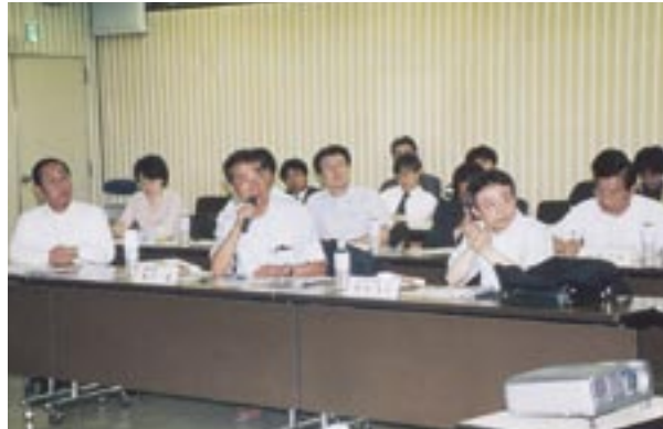
7月25日に上野で行われた設立総会

11月半ばには柏駅東口やアミユゼ柏を中心にイベントを開催しようとする準備が進められています。詳しい内容等は、随時広報などでお知らせ