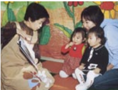
本の楽しさを伝えてみませんか

対象市内在住のかた、25人 活動内容4月からの1歳6カ月児健康診査の会場(柏会場と沼南会場)で、ブックスタート事業の目的を説明します 活動日と募集人数火曜日=5人、水曜日=10人、木曜日=5人、金曜日(沼南会場)=5人※各曜日とも月に1回程度 申し込みはがきに「ブックスタートボランティア希望」と明記し、住所・氏名(ふりがな)・電話番号・希望曜日と応募動機を書いて、〒277-0005柏5丁目8-12 柏市立図書館本館へ、3月10日(金)までに郵送で(必着) ※応募者多数の場合は抽選 その他応募されたかたには講習会を行います ◎詳しくは問い合わせを 図書館本館 ☎