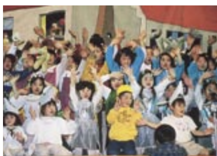
平成16年のステージのようす

とき 3月26日(日)午後2時～3時半 ところ 豊四季台近隣センター体育館 定員 300人※未就学児は保護者同伴 内容 4世代120人が生演奏をバックに演じる手作りミュージカル 費用 無料 申し込み 当日、会場へ直接