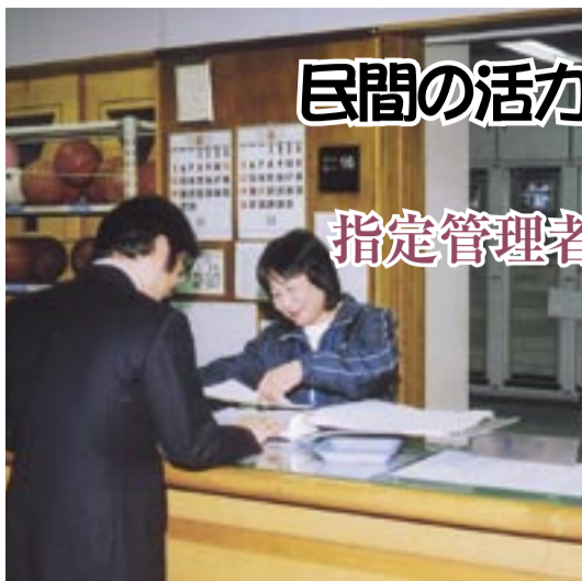
民間事業者による施設管理が始まります

スポーツ施設や福祉施設など、市内の公の施設を民間事業者などが管理する指定管理者制度。昨年12月の市議会平成17年第四回定例会で、指定管理者の指定に関する議案「柏市長」ではなく「指定管理者 ○○○○」と別表「指定管理者制度を導入する施設と指定管理者」の施設で民間事業者などによる管理がスタートします。