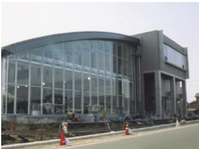
いよいよオープンするリフレッシュプラザ柏

市議会平成18年第一回定例会(3月市議会)は、3月3日(金)に開会します。会期は27日(月)までの二十五日間。今議会では、平成18年度柏市一般会計予算をはじめ柏市行政手続等情報通信技術利用条例の制定など、当初五十三議案が審議されます。