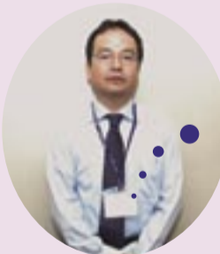
調査員は調査員証を身に付けています

不審な電話には答えず、相手の名前や電話番号を聞いて、事務管理課へご連絡ください。