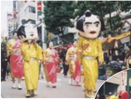
マツケンにテガレンジャーも登場