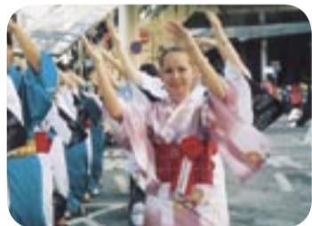
ミスグアムも柏おどりに挑戦