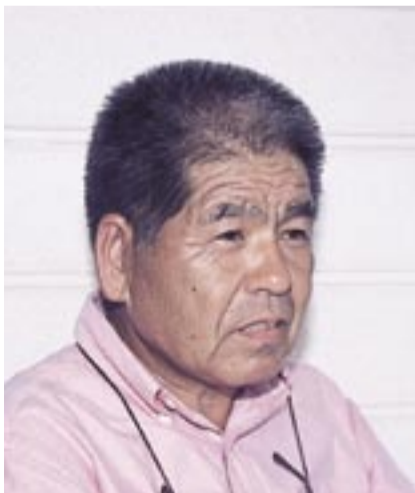
日本煙火協会千葉県支部長・花火師