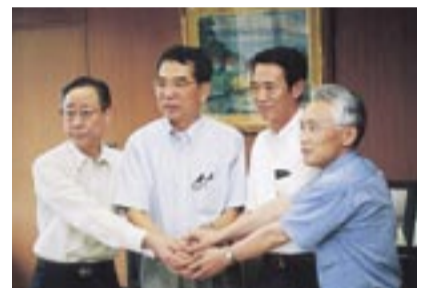
3市1町が協力していくことを確認しました