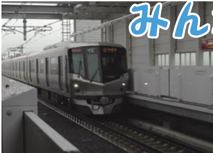
柏の葉キャンパス駅に入線するつくばエクスプレス

発行/柏市 〒277-8505 千葉県柏市柏5丁目10番1号 ☎(04)7167-1111 〆(04)7166-6026 編集/広報広聴課 発行日/毎月1日・15日