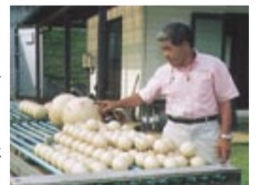
乾燥中の花火。どんな花火を思っって作ったのだろう

市の人口 (17.7.1 現在) 381,055人(前月比340人減) 146,632世帯(前月比238世帯減)