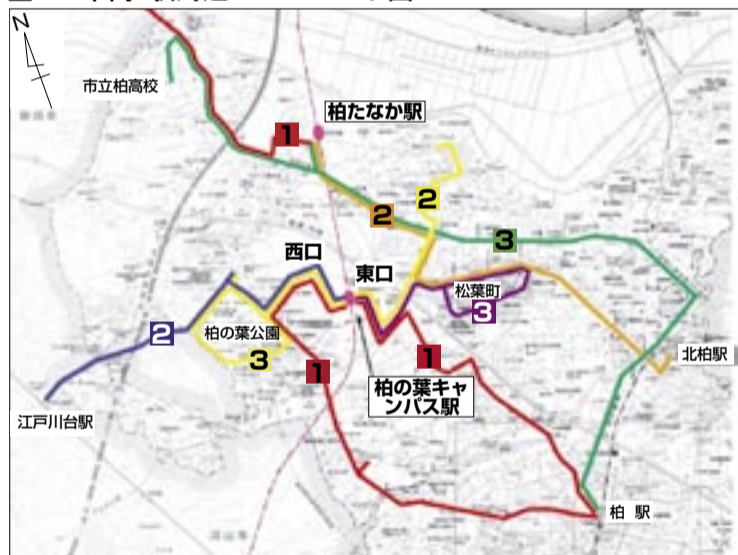
TX市内2駅周辺のバスルート図

【凡例】 柏の葉キャンパス駅東口の路線 (■柏駅西口～松ヶ崎～若柴～駅 2 駅～若柴～花野井木戸～東急柏ビル 3 駅～北柏ライフトアウン～駅) 柏の葉キャンパス駅西口の路線 (■柏駅西口～柏西高校前～駅 2 江戸川台駅～東大前～国立がんセンター～駅 3 国立がんセンター～柏の葉公園～駅) 柏たなか駅の路線 (■駅～灰毛～電建第一住宅～駅 2 北柏駅～ライフトアウン中央～駅 3 柏駅西口～北柏駅入口～駅～柏市立高校)