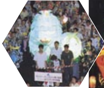
愛知万博のキャラクター、モリゾーとキッコロのねぶたもお目見えしました