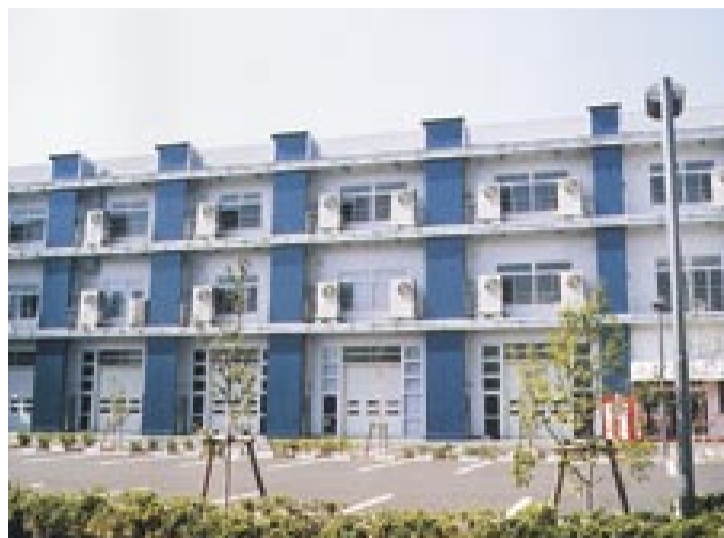
入居が始まった東大柏ベンチャープラザ (柏の葉5丁目)