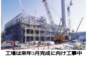
工場は来年3月完成に向け工中

第二清掃工場は、来年3月の完成を目指して工事が進められています。現在、高さ百メートルの煙突がほ