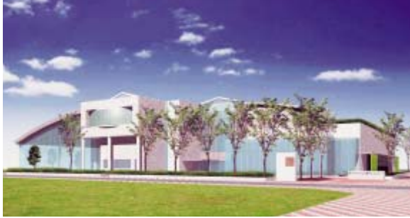
コミュニティ施設の完成予想図