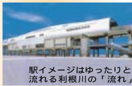
駅イメージはゆったりと流れる利根川の「流れ」

命名理由 旧田中村の「田中」に市名の「柏」を組み合わせ、柔らかさ等を出すためひらがなを使用した