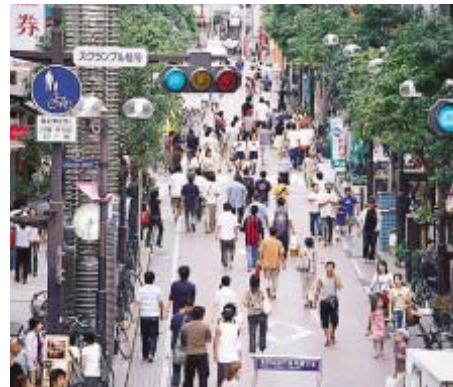
商店街の歩行者通行量を調査します

最近、「働きたいけど働くところがない」「仕事がない」と感じているかたや、事業者のかたが多いと言われています。 市では、雇用・就業の機会をつくることを目的に「千葉県緊急雇用創出特別基金」を活用してさまざまな事業を行っています。 【事業者としての要件】 ・ 常時雇用する労働者が五十人未満である ・ 平成12年～平成14年の売り上げが二年連続で減少し、平成14年の生産指標(生産量・生産額・販売量・販売額のいずれか一つ)が平成12年比で二三分の一以上減少した等 【委託要件】 ・ 委託期間は六月未満 ・ 人件費の割合が全事業費の二分の一以上である ・ 新規雇用者が委託事業従事者総数の十分の一以上である