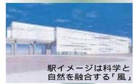
駅イメージは科学と自然を融合する「風」

命名理由 広く定着する地名「柏の葉」と大学などをイメージする「キャンパス」を組み合わせた