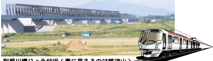
利根川橋りょう付近(奥に見えるのは筑波山)

二年後の平成17年秋に開業予定のつくばエクスプレス。東京・秋葉原・茨城・つくば間五八・三キロメートルでは開業に向けて現在着々と工事が進んでいます。沿線には二十の駅ができて、うち市内には二つの駅が誕生します。このたび、全駅の駅名が決定しましたので市内の工事の進捗よく状況と併せてお知らせします。 市内の駅名については、昨年12月に「柏市つくばエクスプレス新駅名検討委員会」での検討結果を受け、市が県を通じて鉄道の運営主体である首都圏新都市鉄道株式会社に報告していました。10月8日に、その報告とおり(仮称)柏北部中央駅が「柏の葉キャンパス」駅に、(仮称)柏北部東駅が「柏たなか」駅に決まりました(駅の位置などは別掲「市内には駅が誕生」参照)。そのほかの全駅名を含む路線図は別図「つくばエクスプレスの全路線図」とおりです。