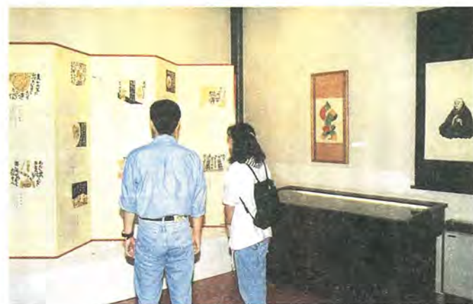
市立砂川美術工芸館では、来年1月18日までの予定で第6回芹沢銈介展を開催中です。今回は、因幡の国(現在の鳥取県)に住む、仏に対する清らかな信心を持つ「妙好人源左(みょうこうにんげんざ)」の温かさを、豊かな想像力で表現した作品などを展示しています。