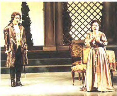
「フィガロの結婚」の舞台での熱演

柏市音楽家協会会員。地元祭りや老人ホームでの合唱指導などのボランティア活動、ソロコンサートなども活躍中。夫と二人の子どもの四大家族。根戸在住。