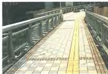
①ゆるい傾斜のスロープ

②歩行面に、自然石(みかげ石、石灰石)を使用しました。また、視覚障害の方にもわかりやすい、黄色の点字ブロックを配置しました。