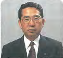
9月市議会市政報告 柏市長 本多 晃

◆柏レイソル・ホームタウンとしてのまちづくり 昨年11月の発足以来、柏レイソルのホームタウンとしての理想的なまちづくりについて、協議、検討を重ねてきた柏市ホームタウン推進協議会から、「理想のホームタウンを」目指して」と題する提言がありました。今後は、実現の方策について、検討していきます。