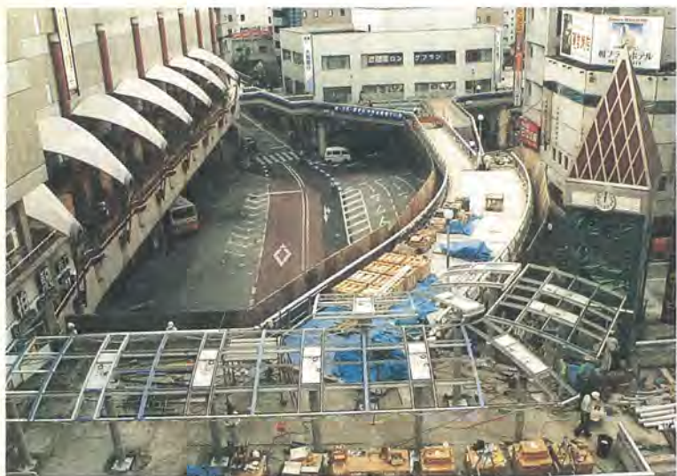
10月1日の開通に向けて工事も急ピッチ