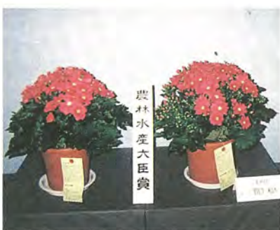
今回の受賞作品のシネラリア。一般にサイネリアとして知られる