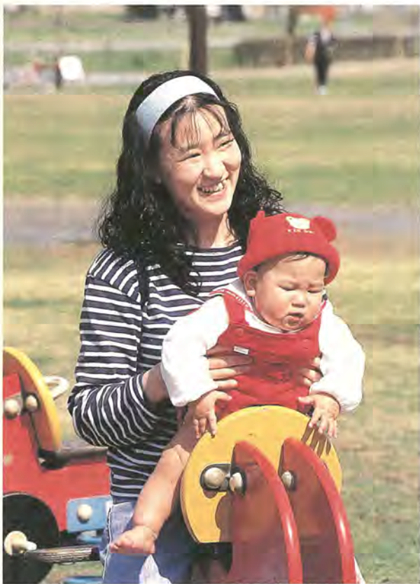
医療扶助の拡大で健やかな成長を応援(写真はイメージ)

平成9年度は、8年度の重点項目だった「福祉」「防災」「文化」の三本柱に、「情報化」「環境に調和したまちづくり」の推進、「市民の健康づくりの推進」の三つを加え、新たな重点項目としました。この六項目について、市民生活重視の視点に立って取り組んでいきます。 まず、「情報・環境・健康」に関する主な施策を（紹介し）ます。 ① 情報化の推進 コンピュータをより活用すること、市民サービスの向上を図ります。 ② 健康づくりのための情報 がん検診の結果をデータベース化し、受診したかた一人ひとりの健康状態を総合的に継続的に管理します。問題点を早期に発見すること、自己管理に役立つデータの提供ができるようになります。平成9年度からシステムを開発し、成人については平成10年度、母子については11年度から稼働します。 ③ ホームページの開設 インターネット上に柏市のホームページを開発し、市や市政に関する情報を掲載します。