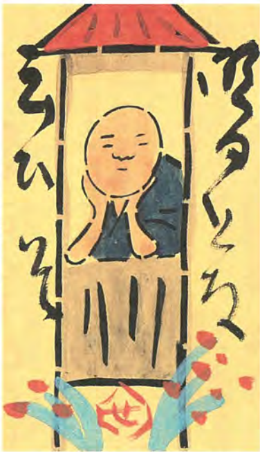
明日とな云(い)ひこそ

「芥沢銚介―春夏秋冬」 5月18日(日)まで※月曜日(祝日・休日の場合は翌日)を除く