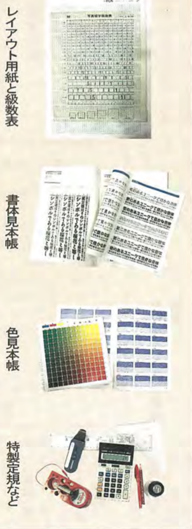
レイアウト用紙と級数表

文字校正で、訂正箇所を指示するときに使う赤ペン。レイアウトで行数を確認するときに使う特製の定規(簡単に確認できるように、レイアウト用紙の一部をはってある)と計算機。巻き取ったフィルムの先端を引き出すときに使う、フィルム引き出し器。写真のピントを確認するために使うルーペ、ストロボ用の電池の残量をチェックする、バッテリーチェッカーなどもあります。