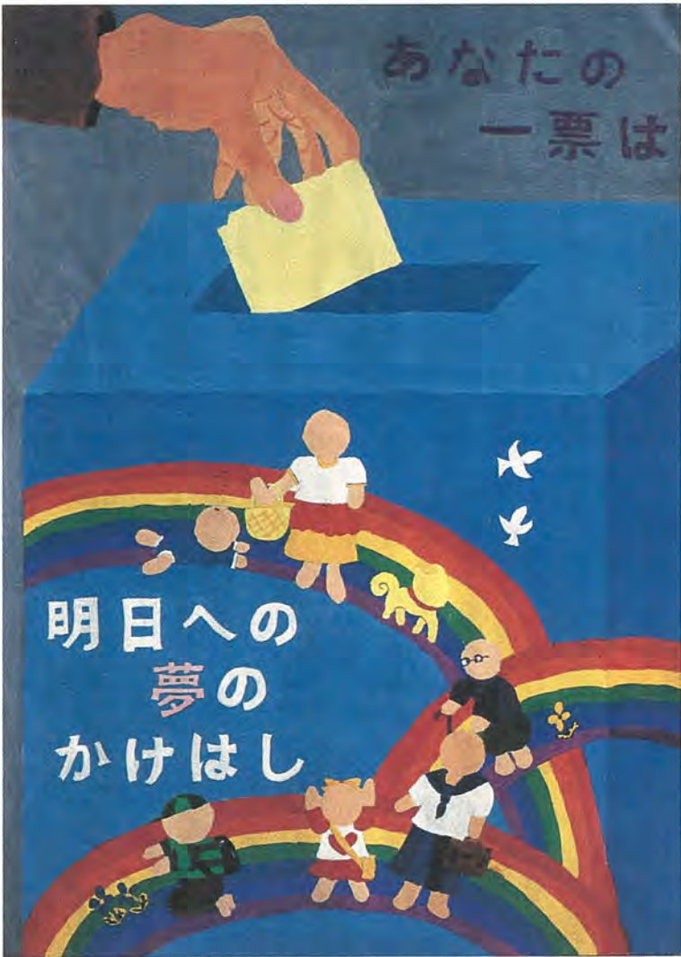
平成7年度明るい選挙啓発ポスター入選 富勢中 井上梓さんの作品