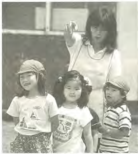
お友達がいっぱい

来年4月に保育園へ入園する ための申し込みを、12月2 日(月)から受け付けます。 できないお子さんを保育す るための申し込みを、12月2 日(月)から受け付けます。