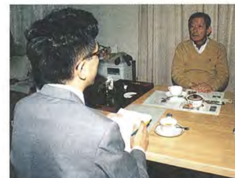
インタビューは、たいへん緊張しています。相手の顔を見ながらお話をメモすると、後で判読できない字になっていることも…

編集会議は、取材記事は簡単な表現に、掲載する記事の大半は、市の担当課から依頼のあったものです。発行日の一カ月前に編集会議を開き、提出されている掲載希望をもとに、面この記事の割り振りを行います。各面の担当者は、割り振られた