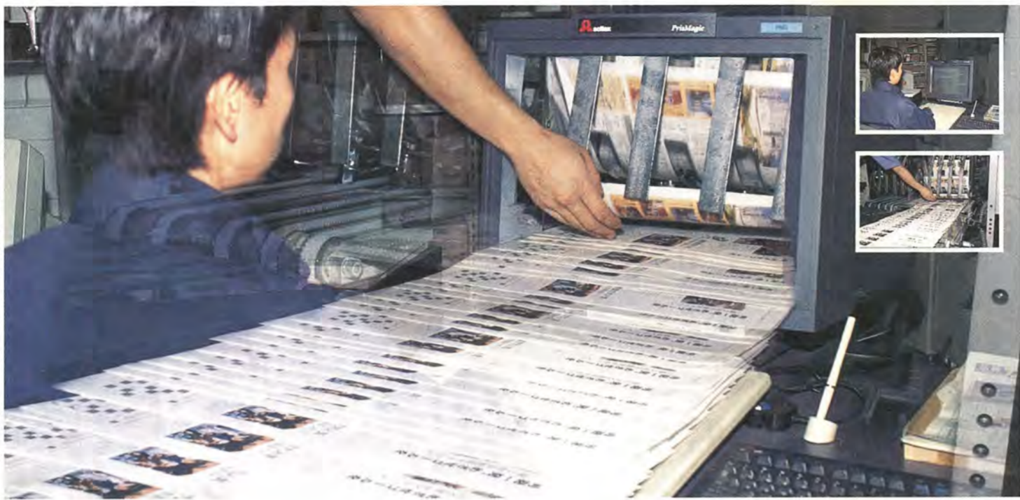
この写真は、画像編集機と印刷機の写真(右がオリジナル)を合成したものです。

「広報かしわ」で掲載する記事は、柏市の行政情報を中心となり、特に、年度当初に決める、計画のキヤンペーン記事のテーマ(今年は「福祉」「防災」「文化」)に関連した記事は、積極的に取り上げます。また、「情報館」や「サークル伝言板」のコーナーでは、国や県、あるいは近隣の市町、民間企業や市民の情報についても、一般に関心が高いもの、役立つものをできるだけ掲載するようにしています。