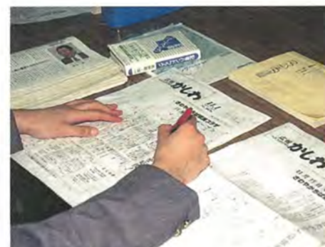
文字校正はどんなに真摯にやっても、思わぬところに落とし穴が…。特に、日時や電話番号などを間違えると、取り返しがつかない。

文字の校正が終わると、次の作業はレイアウト(割り付け)になります。各面の記事の優先順位に基づき、順番にレイアウトします。原稿は、あらかじめ作ったラフなレイアウトに合わせて作りますが、ときどき大幅に原稿がオーバーか、不足することがあります。