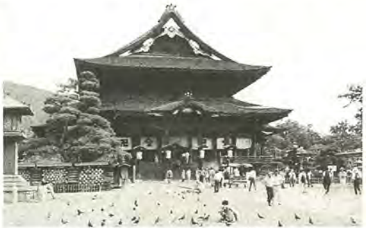
2日目に見学予定の善光寺

晩秋の信州の旅へ、出かけてみませんか。 とき 11月6日(水)～8日(金) 泊三日 コース 別掲のとおり 対象 市内在住・在勤のかたとご家族、先着三十人 宿泊先 菅平かしわ荘 利用交通機関 往復、移動ともバスを利用 費用 大人二万七千円、小学生以下二万一千円 申し込み 10月1日(火)午前9時から、市民生活課へ 電話で、参加が決定したかたは、10月25日(金)までに、市民生活課へ参加費を直接払ってください 市民生活課 ☎54-2000