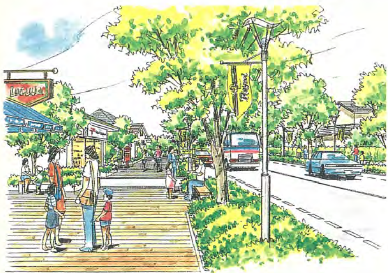
地域循環道路のイメージ