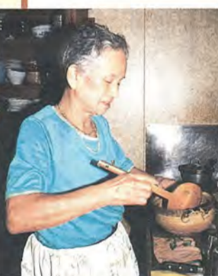
おかやは毎回30分かけて煮ます