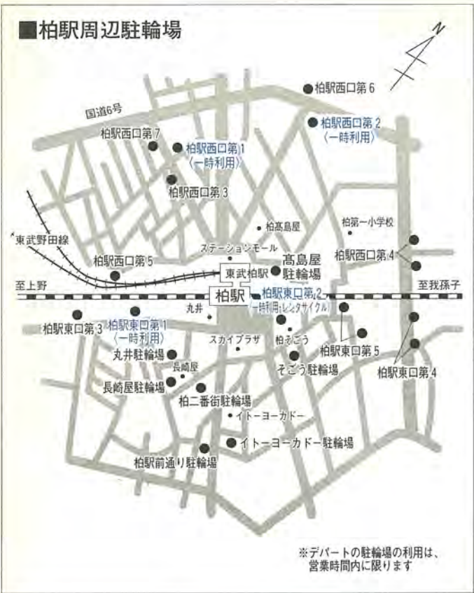
※デパートの駐輪場の利用は、営業時間内に限ります

【場所】 柏駅東口第二駐輪場 【利用開始日】 10月1日(火) 【施設利用時間】 午前6時半～午後10時 【登録制駐輪場】 柏駅周辺には、登録制の市営駐輪場をはじめ、商店会やデパートなどが設置した「買い物客用駐輪場」そして10月から始まる「一時利用駐輪場」「レンタサイクル」などがあります。自分に合った駐輪場を利用し、放置自転車のない街づくりに協力ください。