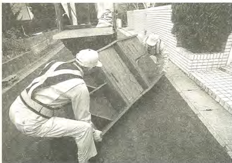
粗大ごみ・布団類の収集の申し込みは1回5点までです