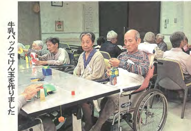
牛乳パックでけん玉を作りました