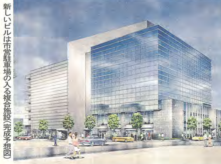
新しいビルは市営駐車場の入る複合施設(完成予想図)

今回、取り壊し工事が始まったのは、旧水戸街道に面する京葉銀行柏支店の入ったビルを含むE-1地区、〇・五三ヘクタール(別図参照)。新しく建設するビルは、北側半分が事業所や店舗、南側半分が市営駐車場の複合施設となります。地上七階、地下二階で延べ床面積は約二万八千方メートル。市営駐車場の収容台数は、約二百七十台を予定しています。