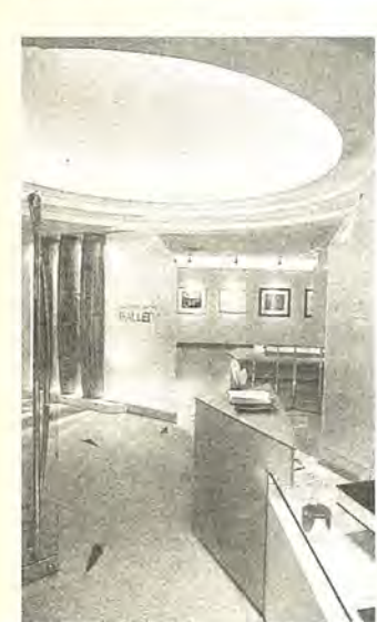
柏文化の発信基地

一種類の病原菌によって、全国規模でこのように多くの食中毒患者が出ることははじめての事態です。私の記憶にもありません。