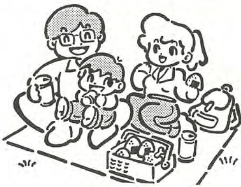
交通安全で楽しい夏休み

千葉大学公開講座「家族で楽しむ園芸」 とき 9月14日・28日、10月12日・26日、11月16日の各土曜日、午前10時半～午後3時(9月14日は午前10時から、場 ☎34-4840)