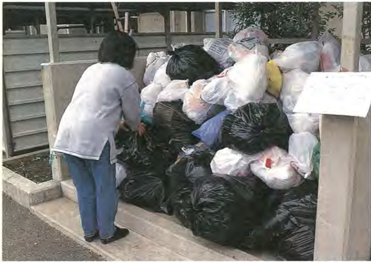
皆様のご協力で定着したプラスチックごみの分別収集