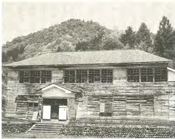
豊かな自然がいっぱい(現在の布沢分校)

柏市とふるさと交流都市を 布沢分校(昭和57年に廃校)を、滞り型の都市と農村の交流体験施設として改修します。