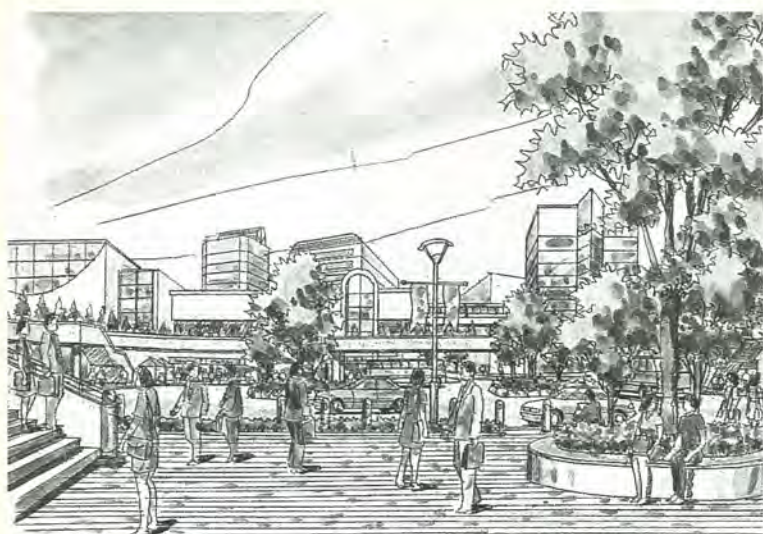
緑園都市中心部のイメージ図

「緑園都市構想」の基本理念は「都市の活力と環境の調和をめざすまち」。職住が近接し、いろいろな機能を備えた自立型の街づくりをめざします。この基本理念を実現するため、次の七つのテーマを設定しました。