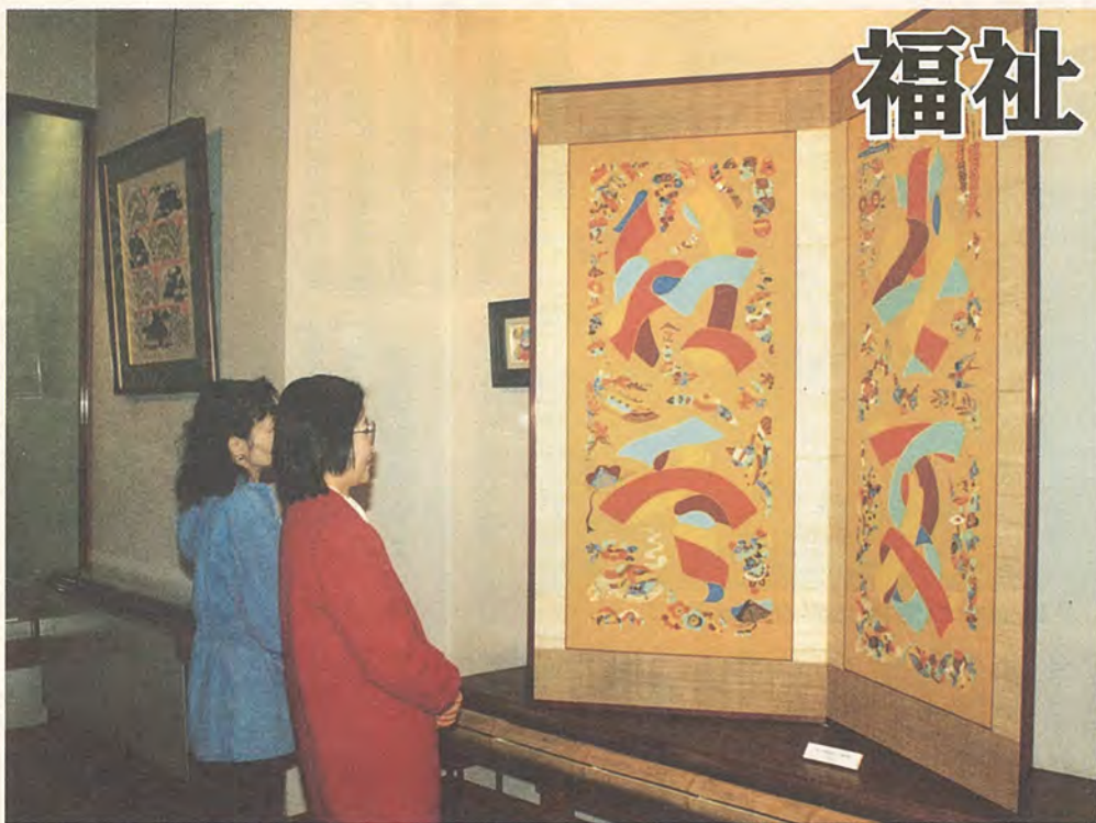
市外からも毎日多くのかたが訪れる市立砂川美術工芸館