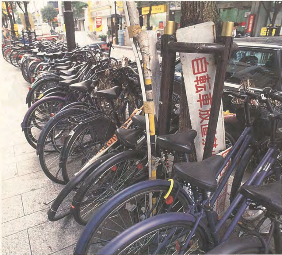
放置自転車は社会の迷惑。必ず駐輪場を利用しましょう