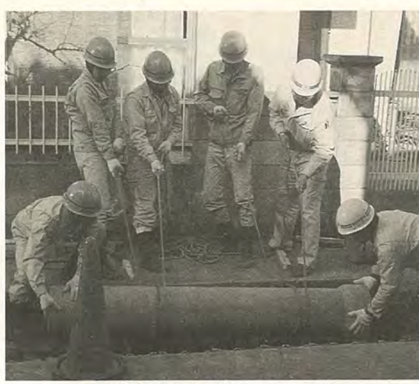
快適な生活に必要な下水道

公共下水道の整備に合わせ、平成8年度に下水道事業の受益者負担金を賦課する区域が決められました。該当する区域に土地をお持ちのかたには、