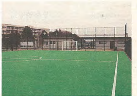
■フットサル場使用料

また、県立柏陵高校そばの逆井宮田島運動場に建設中だったフットサル(5人制のミニサッカー)場、2面が完成。申し込みは、利用の1カ月前から現地管理事務所(☎76-2066)で受け付けます。定休日は月曜日と年末年始など。4月の利用は、4月2日(火)から受け付けます。「気分はJリーガー」で、思いきり汗をかいてみませんか。