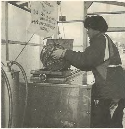
ごみ減量にひと役買ってみませんか

コンポスト・生ごみ処理機などの補助金制度 対象 市内在住で市税を滞納していないかた、または集会施設を持つ町会・自治会で、機器を購入して市内に設置するかた 申請方法 ①市内の農協で購入する場合、印鑑を用意して、各農協(別表1)へ直接、補助金交付の手続きは、農協が代行し