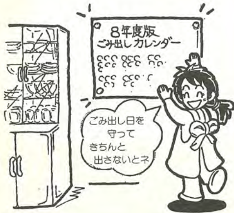
図清掃収集事務所 ☎73-5111

「ウイングホール柏斎場」では、3月10日(日)から、お通夜や告別式を行える式場が使用できます。 昨年11月にオープンした同斎場は、2月までは火葬業務だけを行っていました。このほど、約百台を収容できる駐車場の完成に伴い、全面オープンすることになりました。 式場は、百二十人収容の大式場、七十人収容の小式場の二室があります。各式場には式場控室のほか、遺族・僧り