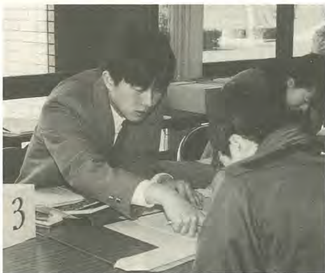
会場は込み合いますので早めの申告を

①所得税の確定申告をするかた ②前年中の所得が給与所得だけで、給与の支払者から市に給与支払報告書が提出されたかた ③前年中に所得がなかったかた ④前年中の所得が条例で定める金額三千万六千円(控