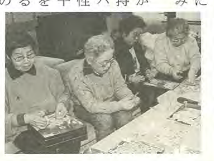
封筒にはられた使用済み