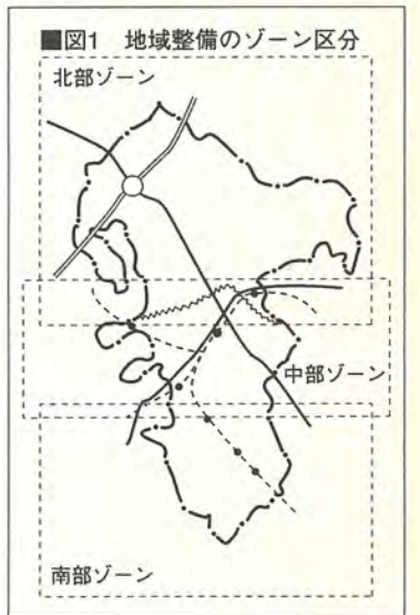
■図1 地域整備のゾーン区分

街づくりは長期的なものであり、二代、三代にわたります。この構想が、特に若い人たちに街づくりに関心をもつていただく一つの契機となればと思っています。