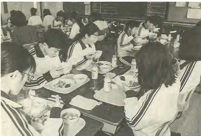
新たに中学校二校に給食室を作ります