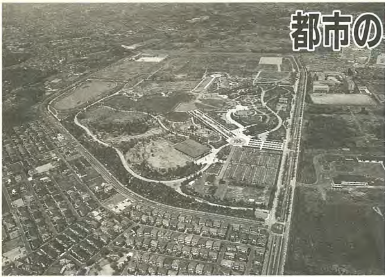
緑の中心核となる柏の葉公園周辺

緑園都市構想は、大堀川以北の地域を対象にして、常磐新線の建設とともに整備を図る北部地域も含め、街づくりに関する市の考え方を提案しようとするものです。この中間報告についての意見は、北部整備部計画調整課までお寄せください。