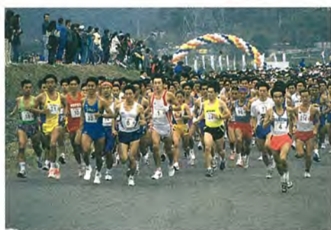
3,500人がいっせいにスタート。一気に飛び出し、先頭グループへ

「第一回手賀沼マラソン」で優勝に輝いた。「初めてのコースだったので、少し不安も...でも、十五キロ地点の折り返し後にトップに立ち、いける」と思った。後はほかの選手がついて来なくなっていました」という圧勝だった。父親に誘われて走り始めたのは、小学校に入ったころ。最初の大会は柏の元旦(がんとん)マラソンだった。以来、中学、高校、大学と、ずっと走り続けてきた。「短距離は素質だけど、長距離は練習。そして試合では、いかに体力を使わずに、燃費よく、走るかで決まる。駆け引きもありますよ。勝負事ですから」。ひょうひょうとしていた表情が、一瞬、鋭くなった。