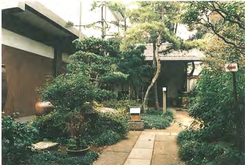
落ち着いた雰囲気の中に建つ砂川美術工芸館

し、入館料は一般三百円、高専道路の用地購入費・工事費校・大学生百五十円、小・中学生百円とします。 ◆平成7年度柏市一般会計補正予算について 平成7年度の一般会計予算を九億二千二百万円増額し、総額八百二十五億五千二百万円に補正しようとするもので、併設するため、継続費(注)の変更を行います。 ※(注)継続費：市の会計は、一年度(4月～翌年3月)で完結するのが原則。事業の性質から例外として、数年にわたる支出できるのが継続費