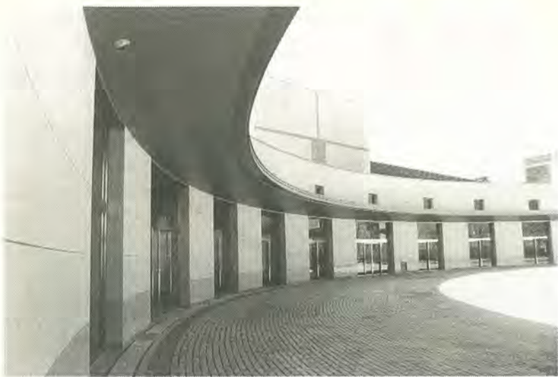
翼を広げた形状をイメージさせる新斎場の外観

平成6年から進められていた火葬場「みたま苑」の建て替え工事が完了。11月17日(金)から、新しい施設「ウイングホール柏斎場」としてご利用いただけます。また、通夜や告別式が行える告別式場も建設されており、来年3月に全面オープン予定です。これらの施設は、柏市・流山市・我孫子市・沼南町の三市一町で構成する東葛中部地区総合開発事務組合(注)〔管理者・本多晃柏市長〕により設置されるものです。