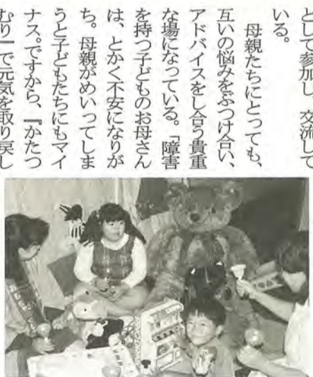
「子どもたちに遊びを通した出会いを」

「子どもたちに遊びを 通した出会いを」 「幼児期にどんなおもちゃに出会い、どんな遊びを体験するかが、子どもの成長に大きな影響を与えるのかたは、連絡を」