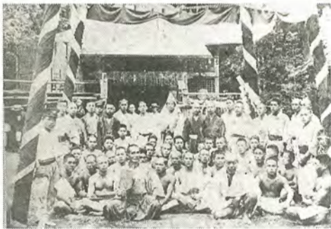
にぎやかに行われていた昭和初期の八朔相撲

「歴史を作るのも継承していくのも我々の役目。ただ古いものを守っていくだけでなく、若い人たちの意見も取り入れて、柏にふさわしい行事にしていきたい」と考えは柔軟だ。また、「ほかに市内の各地域には、今は眠ってしまっている伝統行事があると思うんです。八朔相撲がそれら呼び起こすきっかけになってくれれば、うれしんだけどね」と、ふるさとづくりへの思いを熱く語ってくれた。八朔相撲は、今日10月1日、三十四年ぶりにあけぼの山農業公園で行われる。