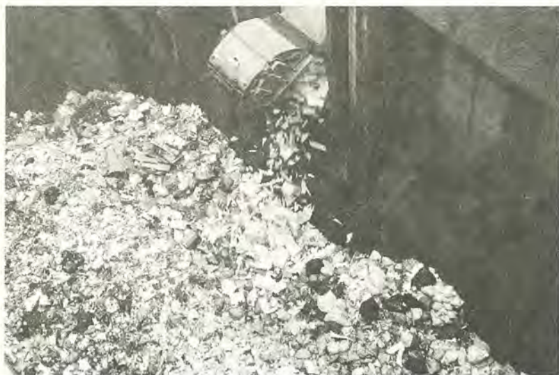
毎日大量のごみが清掃工場に運び込まれています

今回の計画アセスは、次のような清掃工場の計画を前提に行いました。 ①第二清掃工場の稼働開始時期 平成14年度(予定) ②第二清掃工場の処理能力 可燃ごみの処理能力(一日当たり)〓四百トン※現在の