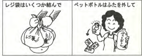
■プラスチックごみの出し方でのお願い