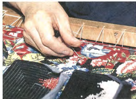
針は1カ月ほどで弾力がなくなり、自然に折れるという

行司の掛け声にふんばる顔は真っ赤。つられて応援にも力が入ります。5月21日、市民体育館で「わんぱく相撲柏場所」が開かれ、620人の小学生が参加しました。物言いがつくほどの熱戦や仲よし同士のほのぼのとした勝負に、お母さんたちも思わず叫んだり笑ったり…。