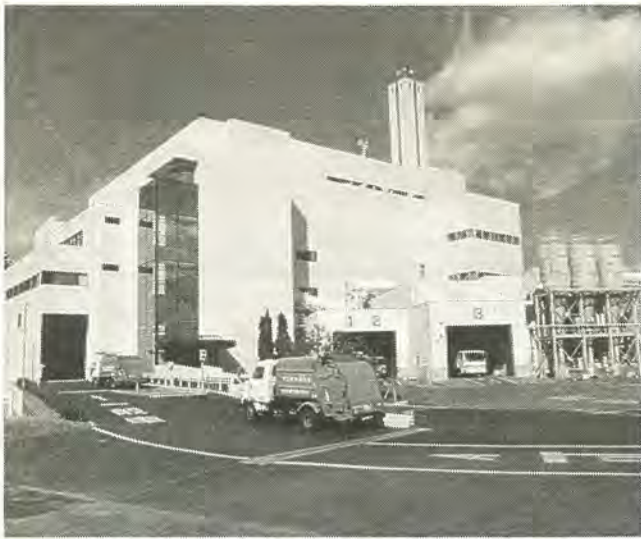
休む間もなく稼働する現在の清掃工場

そこで、市では、工場の負担を軽減するため、ごみの減量と資源化を進めています。今年四月から始めた、ビニール・プラスチックごみの分別収集もそのひとつです。市民