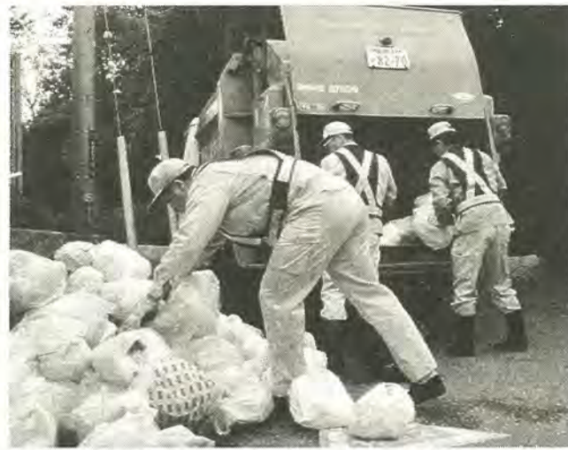
レジ袋はいくつか結んで出していただくと、迅速に収集できます

今年の4月からスタートして、全市一斉に収集を行った、ビニール・プラスチックごみの分別収集。毎週水曜日、4月一カ月間のビニール・プラスチックごみの目とプラスチックごみの収集量は、