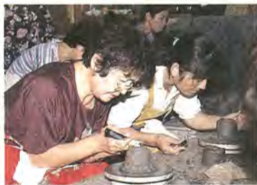
五センチ×三十五センチのペ ニヤ等)など 申し込み 6月2日(金) 午前10時から、新田原近隣セ ンターへ費用を添えて ☎新田原近隣センター ☎67- 1276

申し込み 6月1日(金) 午後1時から、布施近隣セン ターへ電話か直接 ☎布施近隣センター ☎32- 3100