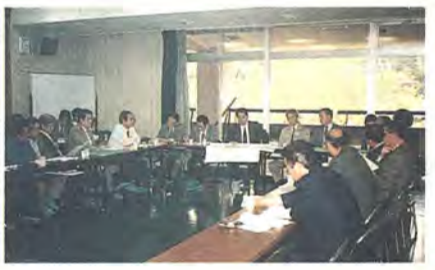
皆さんの意見を市長が直接伺う地域座談会

市民意識調査にご協力いただき、ありがとうございます。お寄せいただいたご回答は、今後の市政に生