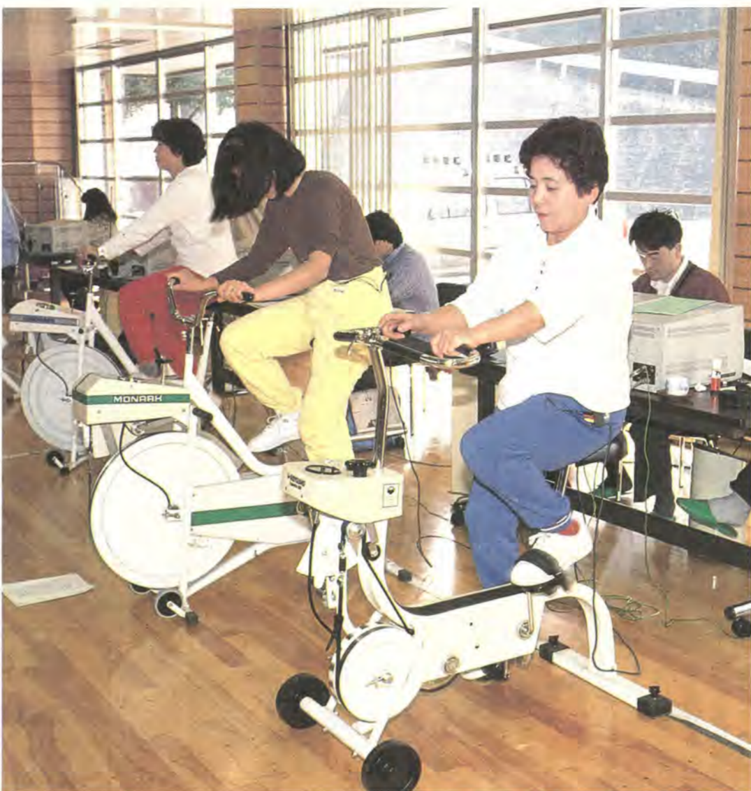
自転車エルゴメーターで運動負荷心電図検査(写真はいずれも、過去の同事業から)