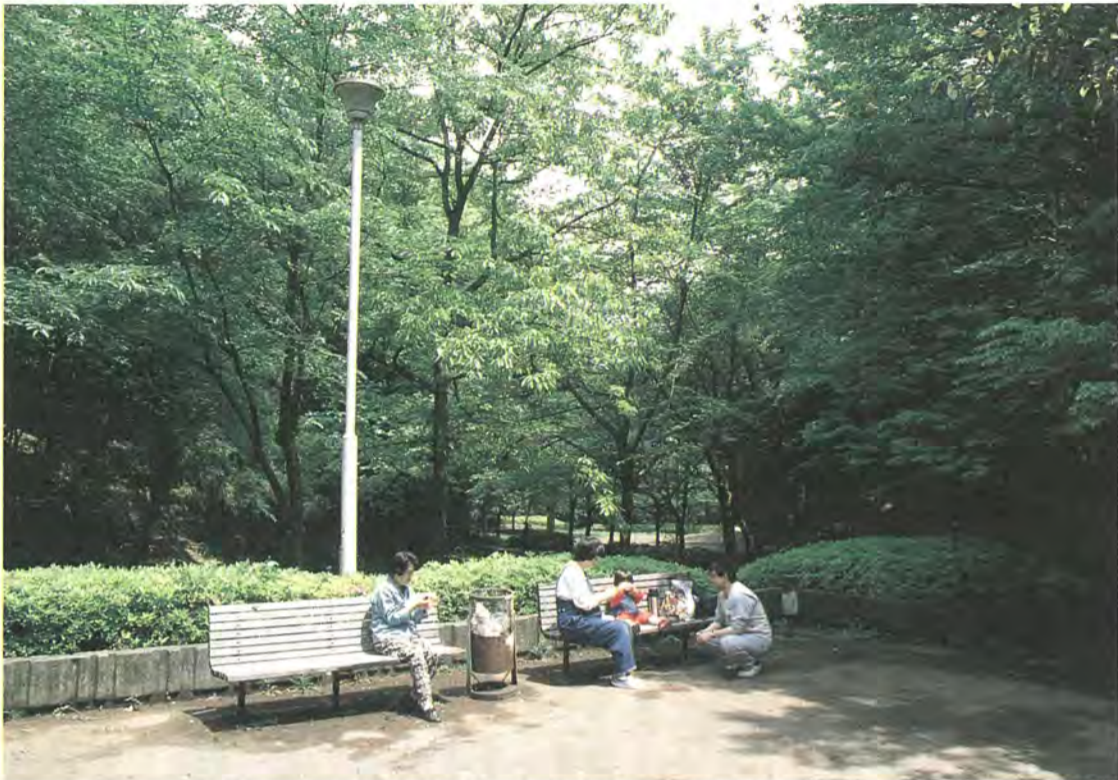
アンケート調査を実施し、市民の声を計画の中にとり入れて整備を進める増尾城址(し)公園