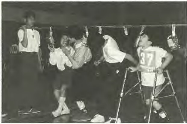
楽しいパン食い競走

子供の卒業後も使用する事もあるか駐輪場の継続をしていました。その間7年間毎年3000円払い込み、利用したのは年に数回のみ、今年は中止しました。この様な利用者には、1回100円とか回数券を発行する等の方法は出来ないのでしょうか。利用の仕方の工夫で放置自転車の数もずっと少なくなることでしょう。(酒井根 匿名・女性 56歳)