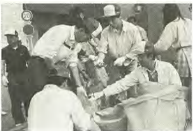
分別が資源化の第一歩

たくさんの方の協力を得て、続けられてきた「ゴミゼロ運動」。十四回目を迎える今年、6月4日に行われます。として再生する努力が続けられてきました。平成4年には、初に行われたのは、昭和46年。牛乳の紙パックが資源品に追加され、続いて平成5年に、可燃ごみと不燃ごみの区分だけでした。その後、増え続けるごみを減らそうと、昭和57年に資源品の回収が始められました。品目は現在と