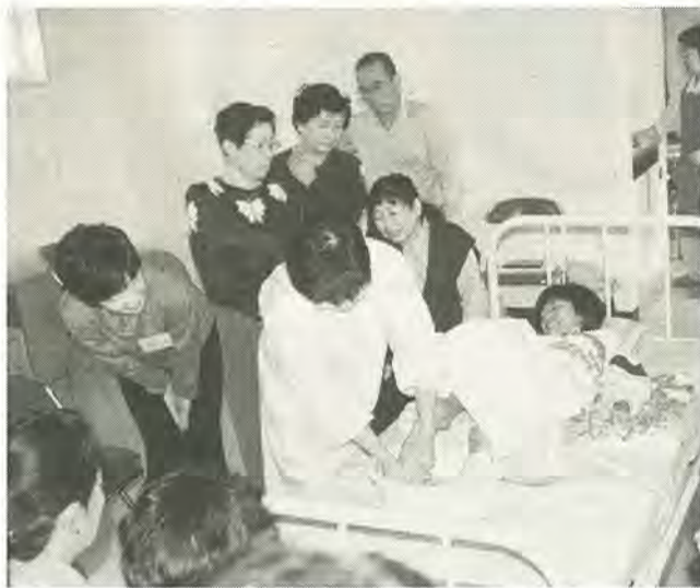
講義と実技で幅広く学びます

「住み慣れた自分の家で、護っていくのはたいへんなことでも暮らしたい」。と、そこで「ホームヘルパー」だれもが持つ、自然な願いの出番です。ヘルパーは、助けが必要な家を訪問し、日常の家事や介護を手助けして、