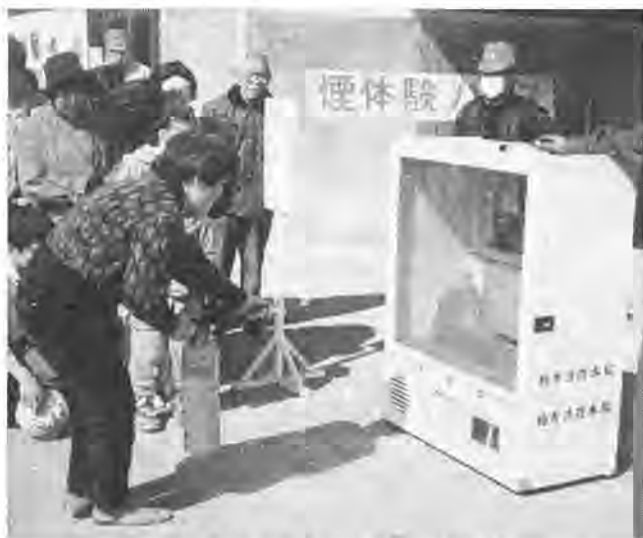
消火器のモデルを使って訓練

春の火災予防運動のひとつ、車や煙体験ハウスなど、多くとして、西部消防署、防火委員協議会、高田地区の七町会による「火災予防フェスティバル」が、三月五日に高田小で開かれました。高田地区にお住まいの約三百人の方が参加して、避難訓練をはじめ、初期消火訓練、起震車体験乗