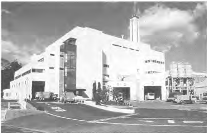
清掃工場は目いっぱい状態です

処理能力ぎりぎりの状態で運転を続けている清掃工場。ごみの焼却量を減らし、清掃工場の負担を軽くしようと、四月からプラスチックごみの分別収集がスタートします。リサイクル運動が定着し、一時ほどの急激なごみの増加はないものの、人口増などによって、依然としてごみは増える傾向にあります。清掃工場がパンクする前に、今、できることから始めなければなりません。四月からのプラスチックごみの分別収集に、皆さんのご協力をお願いします。