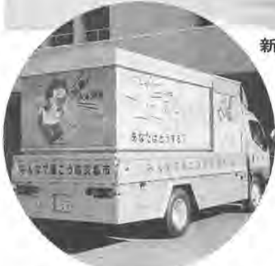
震度7を再現できる起震車

関西地方に大きな被害をもたらした阪神大震災(兵庫県南部地震)五千人を超える尊い生命が奪われました。柏市も消防職員を神戸市に派遣。現地では、厳しい状況の中、救助工作車等を用い、行方不明者の捜索等に当たりました。