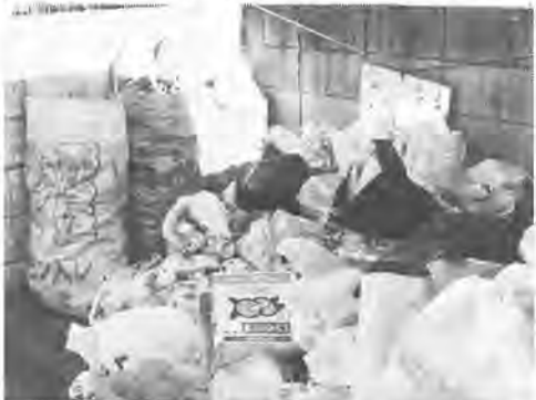
違反ごみ出しは許されません

また毎回の収集でなんらかの形で取り残しの行われている集積所が約千カ所あります。そのうち二百カ所では、本来は集積所に出すことのできない事業系のごみによる、常習の違反ごみ出しが見受けられます。このような悪質な常習者に対しては、現在の法律や条例では効果的な対策を取ることが難しい現状です。今回の条例と規則ができることによって、道路や公園に散乱している瓶や缶がなくなり、ごみ集積所が「ごみ捨て場」でなく正しく利用されるようになることが期待できます。