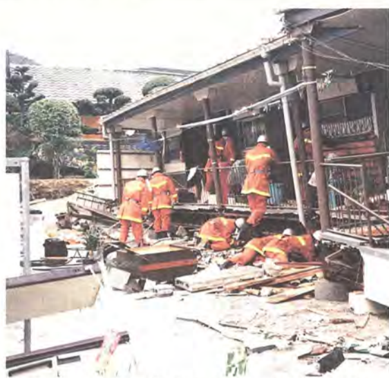
倒壊した家で救出にあたる柏の救助隊

るで両手十本の指でピアノを弾くような演奏」に魅せられてのことだった。メロデーと伴奏を同時に演奏できる深みと厚み。だれでも、どこでも、いつでも楽しめる手軽さ。そして、自分だけが作り出せる手作りの音色。ポケットに