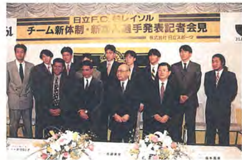
活躍が期待される新加入の選手たち

1月25日の記者会見では、2回のワールドカップでカレカとコンビを組んだ元ブラジル代表・ミューレルら10人の新加入選手と、チーム新体制が発表されました。