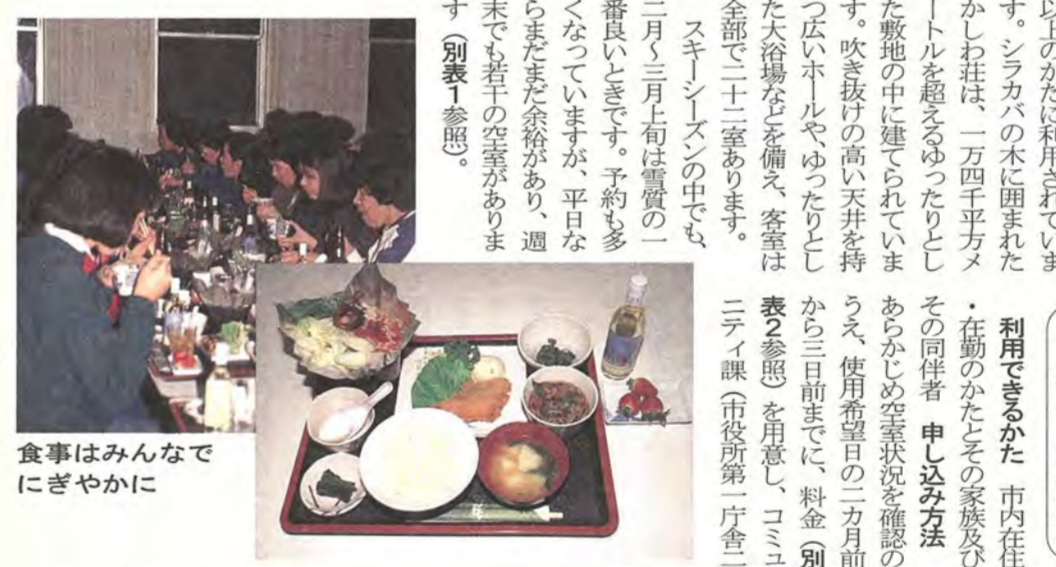
食事はみんなでにぎやかに