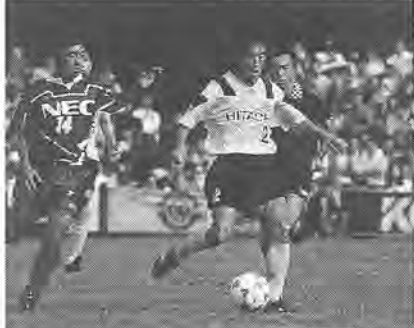
柏レイソル・Jリーグ昇格 市民の悲願だった柏レイソルのJリーグ昇格が決定しました。来春3月の開幕が、今から待たれます。目指すは「優勝」!!

市制施行四十周年を迎えた平成六年。市にとって、大きな節目の年となりました。あなたにとって、今年はどうな年でしたか。