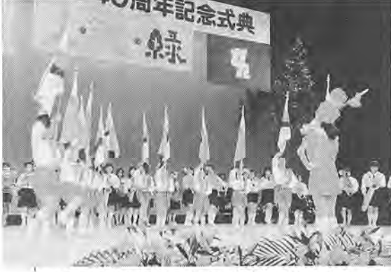
市制施行40周年記念式典・華やかに 11月20日、市制施行を祝う式典が開かれました。席上、市民の皆さんからの公募で決定した「市の花」「市の鳥」が発表されました。