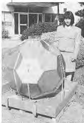
制作が進められているタイムカプセル90