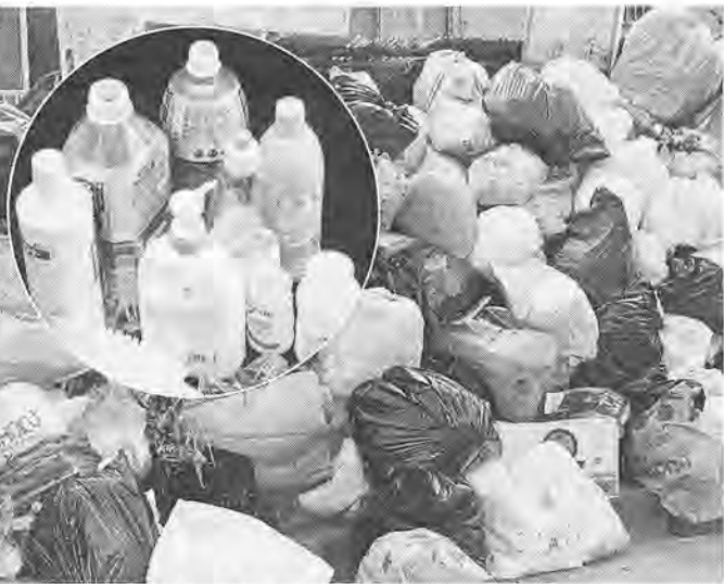
分ければ資源、ごみ減量にも効果が