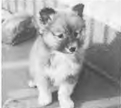
責任をもって飼ってね

私たちの暮らしにやすらぎと潤いを与えてくれるペット。十一月は「動物による危害防止対策強化月間」です。動物を飼っているかた、これから飼おうとしているかたはもう一度、動物について考えてみ