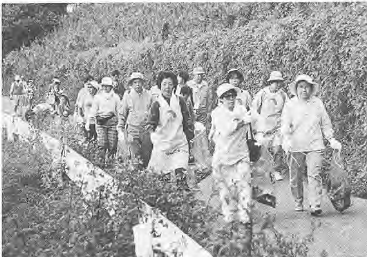
一人ひとりの協力が沼の浄化につながります

毎年、たくさんの方々にご参加いただいている「手賀沼クリーンピクニック」。今年も、九月二十五日に行います。