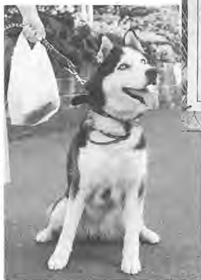
散歩には「ニール」袋を忘れずに