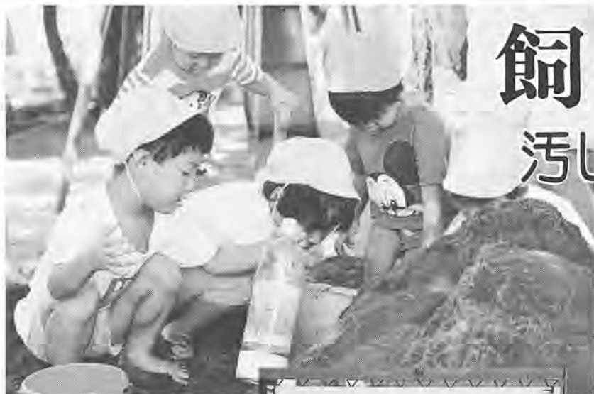
砂場は子どもたちのもの

子どもが遊びます。公園では、犬などにウンをさせないでください。清潔な公園にしましょう。柏市