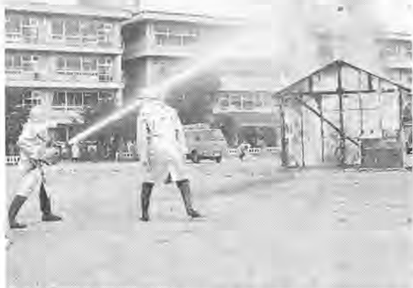
消火訓練は実戦さながらの迫力

今年も柏市では、九月一日 ころ 高田小学校校庭(別「防災の日」に合わせ、図1) 高田小学校を会場に「総合防災訓練」を行います。また、十月二日には東山第二公園で「地区防災訓練」を行います。 昨年、北海道南西沖地震をはじめとする大きな地震が発生し、多くの人命・財産が失われました。 いつ起こるかわからない地震の恐ろしさを考え、いざというときの備え、皆さんお誘い合わせのうえ、ぜひ見学ください。