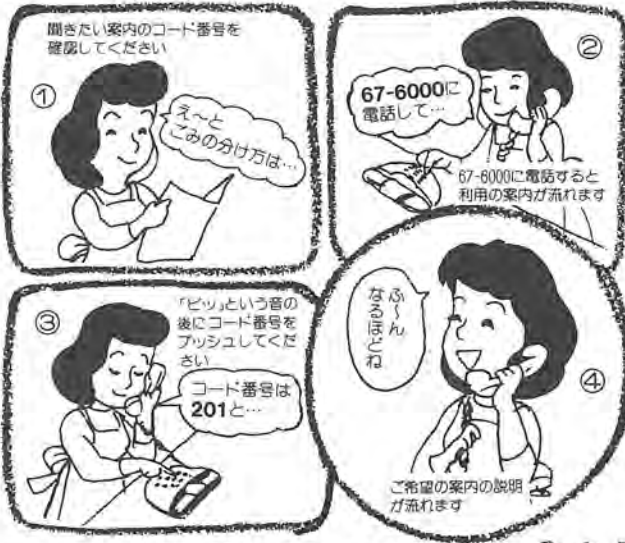
■表1 テレホンガイドかしわ利用状況