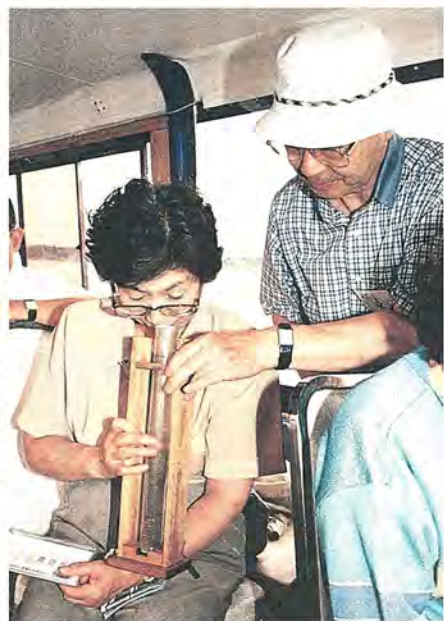
透視度計で水の濁りぐあいをチェック

約六十人の受講生は、二隻の船に分乗して、手賀沼の湖面へ。沼の水深は、平均で八十六センチ。その下にたまたったヘドロは、深いところでは二・三メートルあります」との市職員の説明。これに続いてバケツ