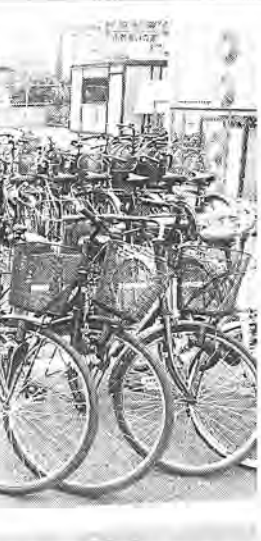
「放置自転車ゼロ」をめざして自転車駐車場の整備を進めます

または決定しなければならぬ事項を、緊急の場合などに議会でもこれを報告し、承認を求めなければなりません。