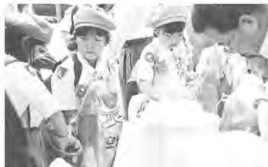
市民3万人が参加して行われた、5月29日の「ゴミゼロ運動」。空き缶・空き瓶13.5トンと、可燃・不燃ごみ10.2トンの計23.7トン回収しました。わずか1時間半ほどの間に、集積所に山積みになったごみや資源品を見て、参加者からは「捨てないことが一番なんだけどねぇ…」の声。