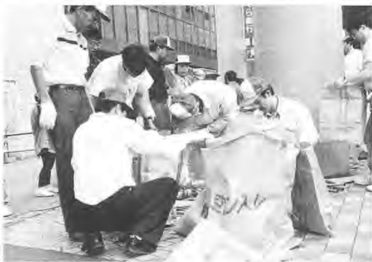
市内各地から3万人が参加(昨年のゴミゼロ運動)

「ごみのない、清潔な街づくりにすることが、大きな足がかり。それには、まず自分たちの身のまわりの環境をきれいにか。」