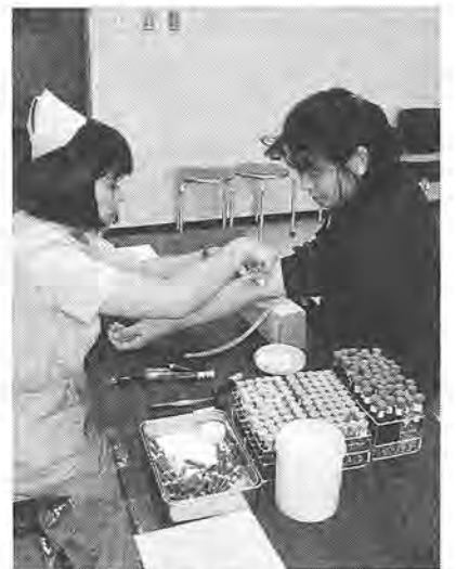
さて、判定は適？不適？

健康には自信があるつもりでも、運動不足を感じているかた、運動を始めたけれど、事業に参加したことのあるかた、