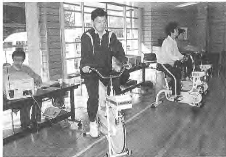
トレーニング前には入念なチェック