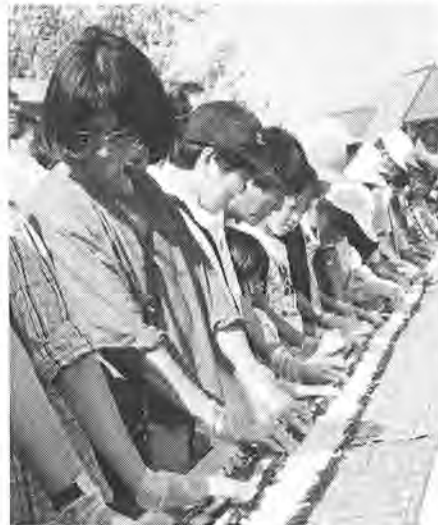
40メートルの太巻きずしに挑戦

この日、これまでに完成していた「風車と水辺の広場」や「加工実習館」などに加え、「郷土資料館」がオープンし、「バーベキューガーデン」も営業を始めました。今回のオープンに合わせて、さまざまなイベントが行われた。プラザ広場は、活気があふれ、とてもにぎやか。野菜・花の即売や、牛の丸焼きは、長蛇の列ができるほどの人気。「ふるさと交流」をして