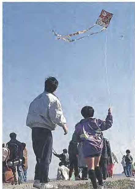
「パパもたこあげした?」「うん、空き地でよく遊んだよ」

昔ながらのお正月の遊び、(すいせき)橋近くの利根運たこあげをみんなで楽しもう。今年も一月二十三日に七回目を迎えた今年も、千超えるたこが寒風に乗って大空に舞いました。また、青森県柏村からは、大たこが届けられました。この日の風は少し弱く、残念ながら「天まで上がれ」とはいきませんでした。