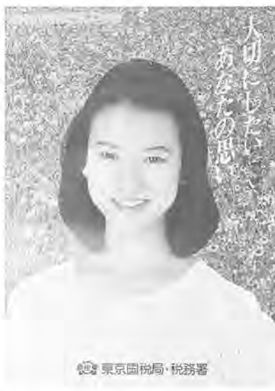
東京国税局、税務署

確定申告書の提出期間は、二月十六日(水)から三月十五日(火)までです。しかし、還付申告だけは、柏税務署(別図参照)で既に受け付けを開始しています。早めに申告を済ませてください。また、柏税務署では、別表2の日程で出張受け付けも実施します。