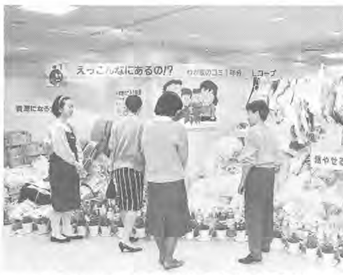
まず「関心を持つこと」が大切(昨年の同展から)

日常生活にまつわる、さまざまな問題を取り上げてきた「みんなの消費生活展」。 第二十三回を迎える今年のテーマは、「食」(シヨック)キング・ナウーあなたの食事は、本当に豊かと言えらるでしょうか。 飽食の時代と言われる現代。雑誌やテレビでは、「おトク」を当て、生活の基本である「食」についての展示会を行います。 毎日の食卓、考えてみませんか。 とき 2月2日(水) 6日(日) 午前10時～午後7時(6日は午後5時まで) ところ 柏市三つ八階大催事場