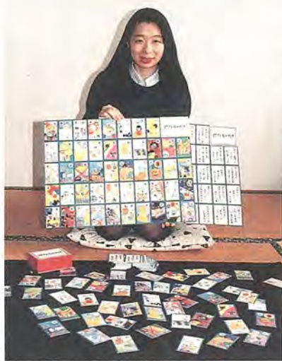
ごみの「物知り博士」になれるよ

とき 2月18日(金) 午後1時半～4時 ところ 教育福祉会館5階講堂 対象 市内在住のかた・市内の事業所のかた、先着200人 内容 事例発表「自らの手できれいなまちづくり」・「資源化率24パーセントを振り返って」 講演「事業者責任ってなに」 費用 無料 申し込み 2月1日(火) 午前9時から、クリーン推進室へ電話か直接 問い合わせ クリーン推進室