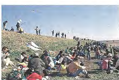
土手にはギャラリーがずらり

直径一メートルほどの大鍋二つに、千人分のとん汁が用意されましたが、一時間半でなくなるほどの大人気。隣の人と語りながら、冷えた体を、暖めていました。 なお、この大会の様子は、二月六日(日)正午から、千葉テレビで放映されます。