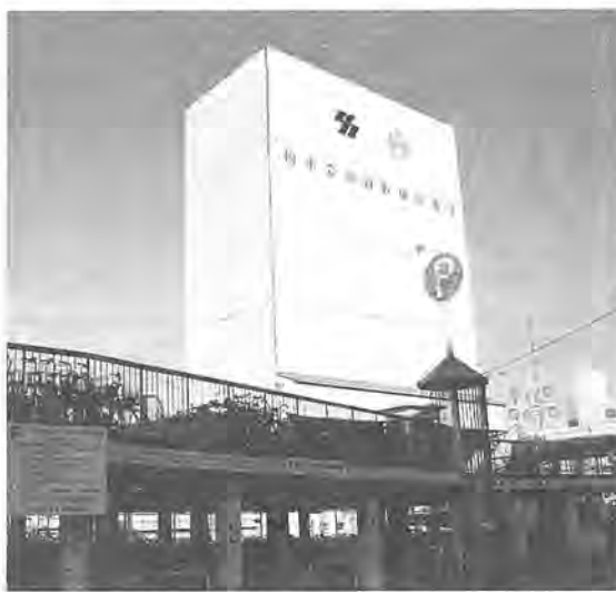
柏駅東口第1自転車駐車場