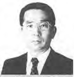
施政方針 市政報告

【JR北柏駅のホーム内工】 スカレーター付き階段増設ラッシュ時の混雑緩和のため、エレベーター併設の階段が、来年夏ごろまでに増設されることになりました。南口階段についても、エレベーターを設置するよう、今後も協議を続けてまいります。