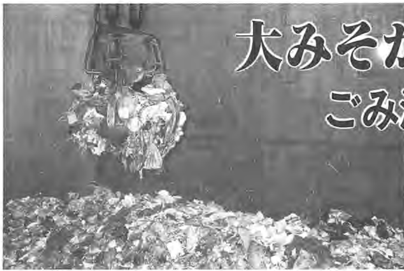
焼却炉をフル稼働しても燃やしきれないごみがたまっていき...