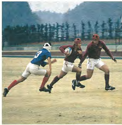
トライ目指して全力疾走

優勝候補の筆頭と言われていた同校は、プレッシャーと市立稲毛高の予想以上の健闘の前に、前半は10対6と苦戦を強いられました。しかし、後半は平均体重九十キロの強力フォワードが本来の力を発揮し、一気にトライを重ねました。