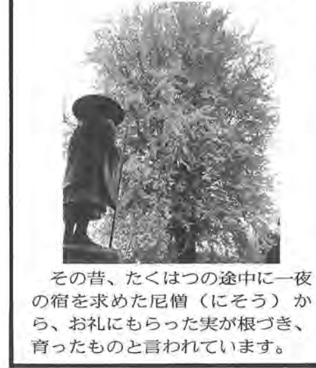
その昔、たくはつの途中に一夜の宿を求めた尼僧(にそう)から、お礼にもらった実が根づき、育ったものと言われています。

早期発見が大切 神経芽細胞腫検査 対象 市内在住の一歳未満の乳児 検査時期 生後六、七カ月ころ 検査方法 検査用紙に尿をしめらせ郵送 費用 無料 検査用紙の配付 母子健康手帳発行時に配付