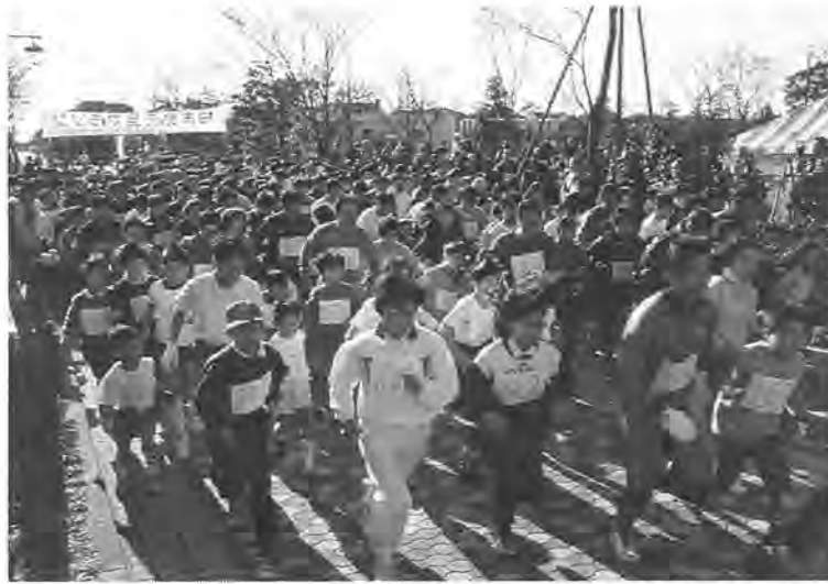
1,685人が参加した、今年の元旦マラソン

一年の始めに、さわやかな汗を、 毎年恒例の、「柏市民元旦(がんとん)マラソン」の参加者を募集します。 参加部門は、中学校男・女