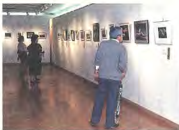
プロ顔まけの作品も

「勤労者芸術展」が、柏市民から始まり、今年で二十回目。今回展示された作品は、絵画の部が四十一点、写真の部が三十九点の合計八十点。第二十回の記念展にふさわしく、とてもアマチュアとは思えないほどのできばえの作品が勢ぞろい。