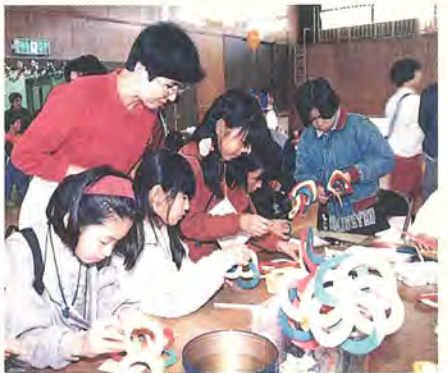
うまくできるかな、風ぐるま

など約五千人が訪れ、各イベントのコーナーは大にぎわい。ペーパークラフトコーナーでは、色紙や牛乳の紙パックで、風ぐるまやけん玉作り、熱中。カラメラ作りコーナーでは、子ども