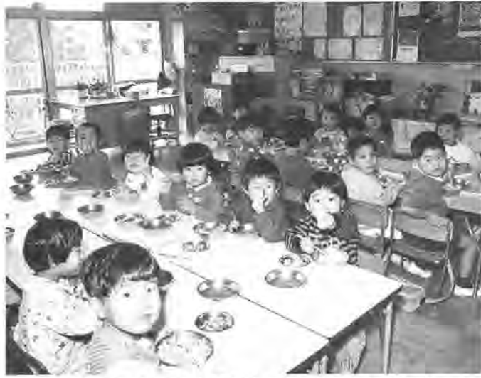
みんなで食べるとおいしいね(松葉保育園)

・妊娠中、または出産して間がない ・病氣、または心身に障害がある ・病氣、または心身に障害がある同居の親族を介護している