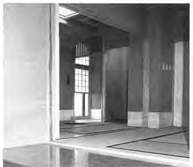
趣のある茶室で、ゆとりの時間を

老人福祉センターは、高齢者の皆さんに、教養の向上、健康増進及びレクリエーションの場として、利用されています。 地域のかたとのふれあいを大切にした、活気にあふれるセンターを目指しています。