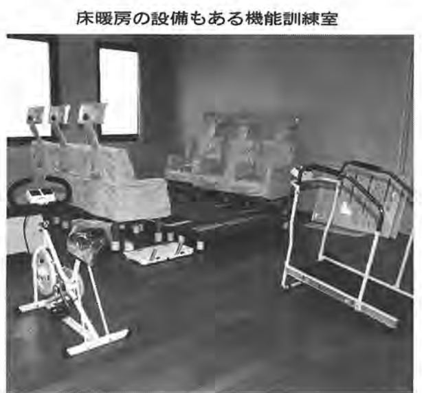
床暖房の設備もある機能訓練室