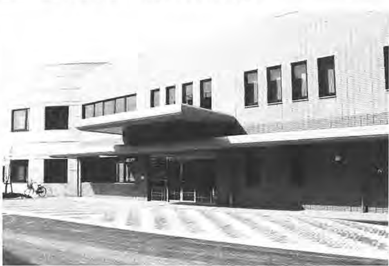
南部地区の老人福祉の拠点となります

現在、市の行政運営の基本のひとつとして建設が進められてきた「柏市第三次総合計画」の中で、お年寄りのための施策の中心事業の「木」、藤心にオープンします。 同センターは、柏寿荘、中央老人福祉センターに続き、市内では三番目の老人福祉センターです。