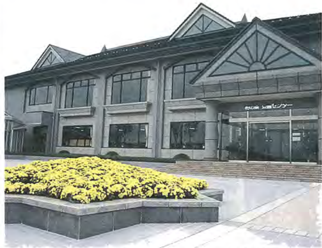
センターには緑の相談コーナーもあります

先日行われた、サッカーのナビスコ・カップでは、六試合で四つのゴールを決め、大物ぶりを遺憾なく発揮した。