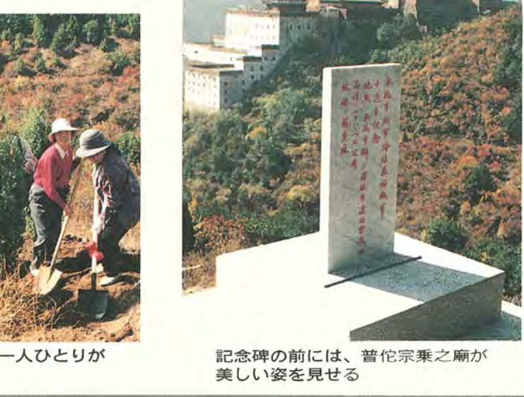
記念碑の前には、普陀宗乘之廟が美しい姿を見せる

友好都市締結十周年にあたり、三百九十九万承德人民を代表して、柏市市民の皆さんに、熱烈なお祝いをお申しあげます。またこの友好都市締結十周年を記念し、承德市の緑化事業に協力いただき、友誼林を整備することとなりました。柏市市民の変わらぬ友情に深く感謝申し上げます。今後とも、両市の友好関係を深めたいと思っております。