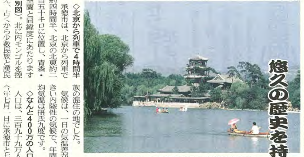
湖、平原、山が広がる避暑山荘の大庭園

昭和五十八年十一月一日、柏市は中国河北省承德市と友好都市を締結しました。以来、両市は相互理解を深め、さまざまな分野で交流を展開してきました。今年十一月一日は、友好都市を締結してちょうど十周年、これを記念して、柏市では承德市の緑化事業に協力する(と)となりました。また十月には柏市友好訪中団が承德市を訪問し、記念行事等への参加を通じて締結十周年を祝い、交流を深めました。今号では、改めて承德市の横顔を紹介するとともに、両市の交流についてお知らせします。