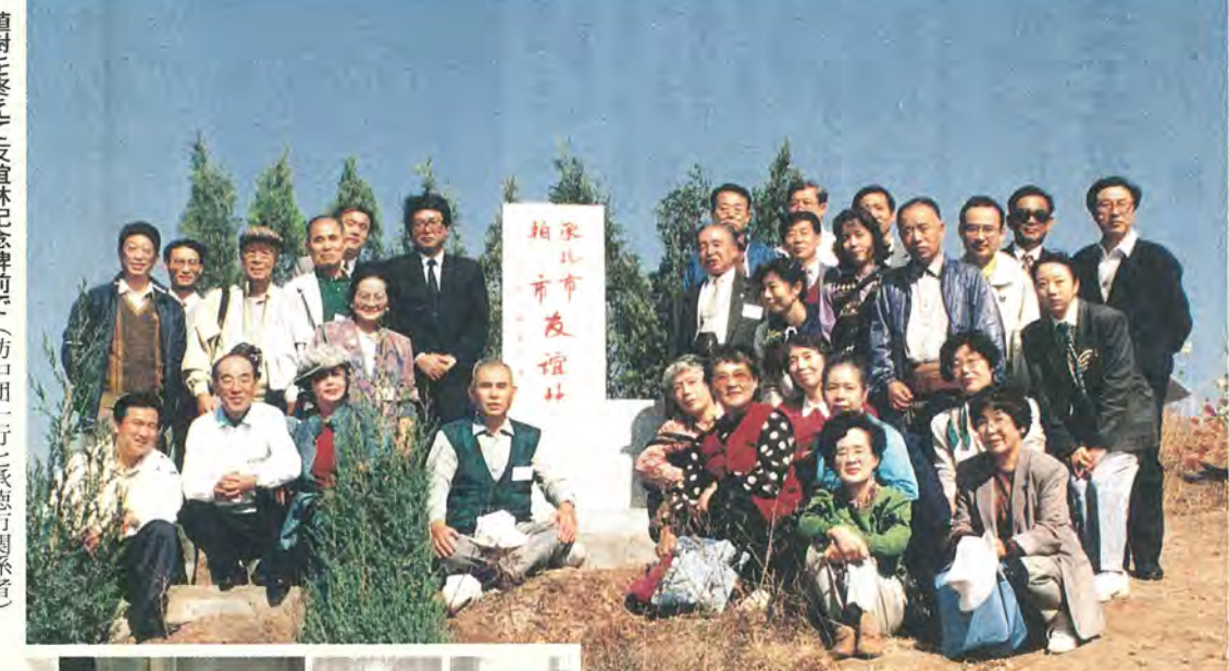
植樹を終えて友誼林記念碑前で(訪中団一行と承德市関係者)

昭和61年8月と平成3年8月、両市の青少年が承德市で、親ほくを深めました(写真=第2回青少年訪中団)。