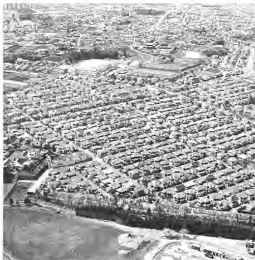
まちづくりに生かします「固定資産税」