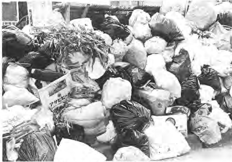
可燃ごみの中に瓶や缶は混ぜないで