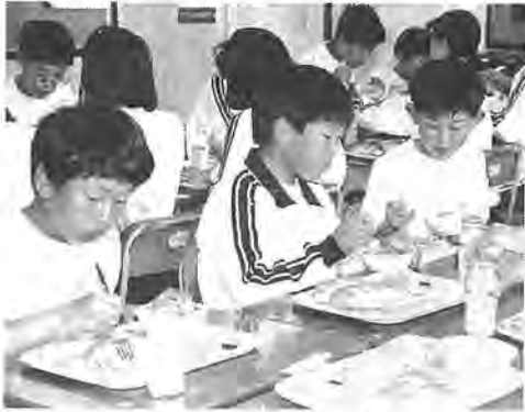
みんなで楽しく給食を

第三中学校では、市の給食調理員が調理を行い、南部中学校では、調理を専門業者に委託する方式で実施。栄養のバランスへの配慮はもちろん、給食の献立も和食・洋食・中華とバラエティー豊か。事前に生徒にアンケートを取り、人気の高かったメニューを取り入れるなど工夫を凝らしています。食器は強化磁器製で、美しく清潔感があるものを使用しています。