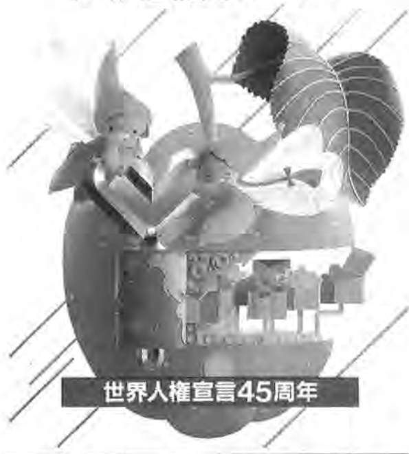
世界人権宣言45周年