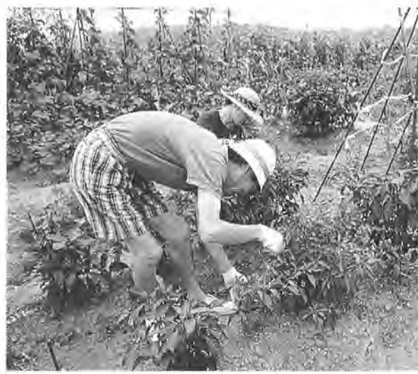
自作の野菜が食卓を彩ります

あけぼの山周辺整備事業の一環として、布施弁天の東側に昨年四月にオープンした市十区画の農園を整備し、新規市民農園(ふるさと農園)の利用者を募集します。