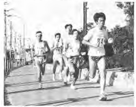
日ごろの練習の成果を存分に発揮

晴天の冬空のもと、一月一日、柏の葉公園周辺道路を会場に「市民元旦(がんばらん)マラソン」が行われました。今年で三十二回を迎えた今大会には、千六百八十五人が