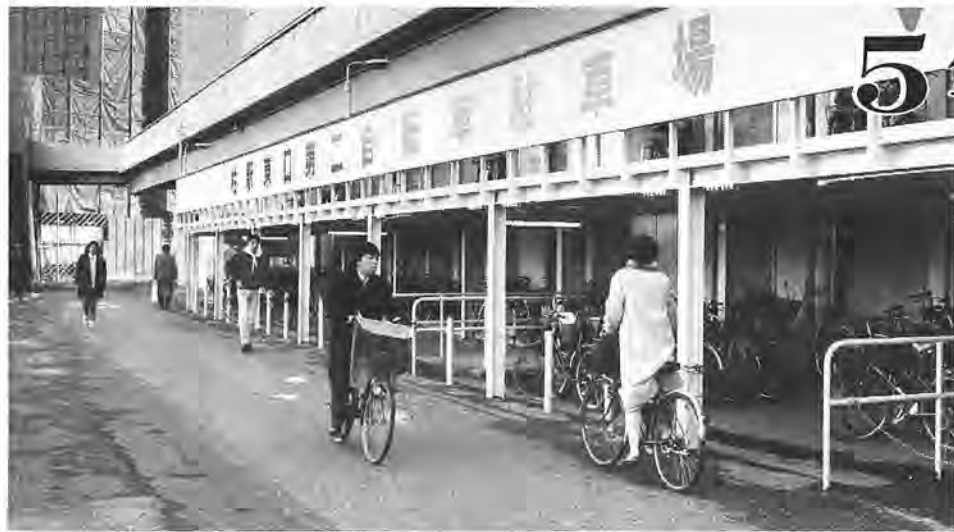
駐車場を利用するには、まず登録から