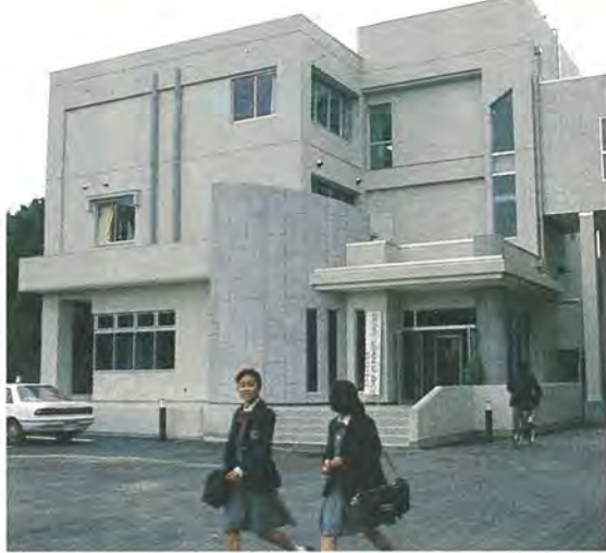
このたび完成した新館

これら研究の成果は、十五年間講師を務めた真老人大学などですべて発表し、多数の著書も出版している。中でも「たのしい菊づくり」は、三十万部も出版され海外でも人気が高い。「菊づくり上達のコツは、飽きないこと。菊ひと筋に専念すれば、誰でも立派な花を咲かせられます。私が、ここまで、これだけの功績のおかげ。菊づくりは、家庭円満のもとです」と語った。