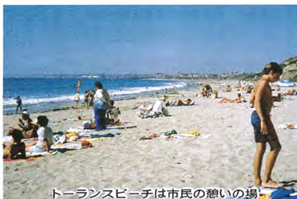
トランスビーチは市民の憩いの場