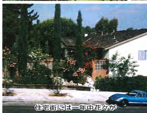
住宅街には一年中花々が