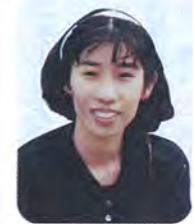
活躍する英語講師