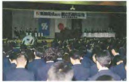
体育館で盛大に行われた式典

市立柏高校は、現在普通科と国際科の二課程で、全校生徒数二千二百二十二人。全日本吹奏楽コンクールで、四回金賞を受賞している吹奏楽部をはじめ、野球部やバスケットボール部などが、全国レベルのめざましい活躍をしています。