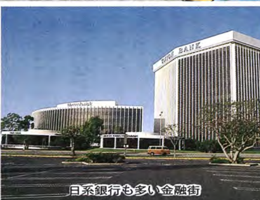
日系銀行も多い金融街