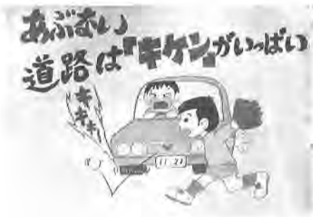
山名 健太君の作品 (6年生の部最優秀賞)