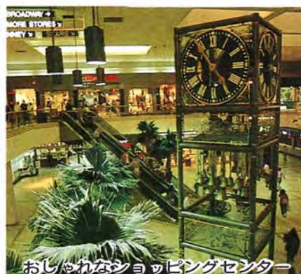
おしゃれなショッピングセンター