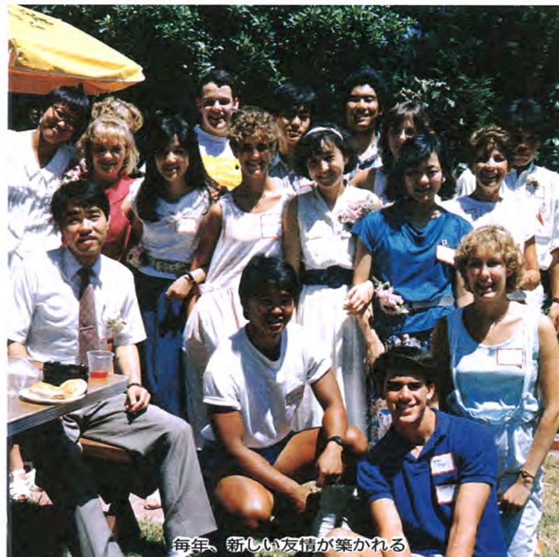
毎年、新しい友情が築かれる

柏市がアメリカ合衆国カリフォルニア州トランス市と姉妹都市になったのは、昭和四十八年。来年二月二十周年を迎えます。この間、両市・両市民の間では、毎年夏に行われる青少年の交換派遣事業を中心に、教育・文化・スポーツなどさまざまな分野で、交流が行われてきました。しかし、言葉の壁などの問題から、まだまだ全市民の中に根づいた「市民レベル」での交流は言えない現状にあります。その一方、他の自治体には、実質的な交流が行われていない名目だけの「姉妹都市」関係も少なくありません。トランス市は、成功例として高く評価されています。私たちにとって、これまで二十年の姉妹都市活動は何だったのでしょうか。友都市の中国・承德市、アメリカ准州・グアムも含めて、さらに美りある交流活動を通じていくために求められているのか、考える好機です。