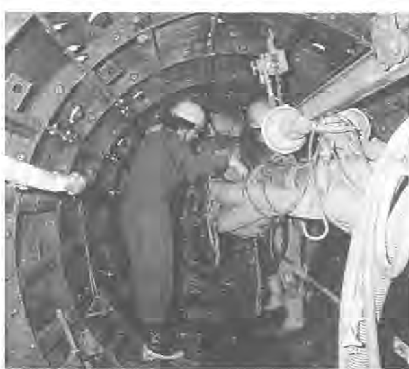
下水道は快適な生活に欠かせない都市基盤

九月一日から、増尾字種荷、み取り式トイレを使用している谷津・字三本木、光ヶ丘二丁、三丁、四丁、五年以内水洗化の各一部、計七・七ヘクタールを、法律で義務付けられています。また、し尿浄化槽を使用している区域は、新たに公共下水道の処理区域になります。 この区域にお住まいのかたは、すでに水洗トイレに改造しているかたは、できるだけ早く、公共下水道に接続して接続工事を行うとともに、