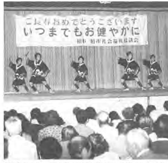
地域でお年寄りをお祝い(昨年の敬老会から)

九月十五日は「敬老の日」。年寄りの長寿を祝う敬老会です。市では、お年寄りの皆さんが、これからも元気に過ごしていただけるよう、「敬老の日」に合わせて、敬老会や長寿者訪問、金婚祝賀会などの催しを行います。 柏市には、敬老会が各行政区で、趣向を凝らして行われます。記念品が手渡され、お祝いの言葉を述べ、敬老会や長寿者訪問、金婚祝賀会などの催しを行います。 敬老会では、お年寄りの皆さんが、これからも元気に過ごしていただけるよう、「敬老の日」に合わせて、敬老会や長寿者訪問、金婚祝賀会などの催しを行います。