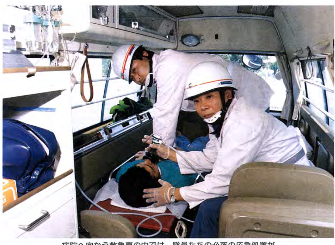
病院へ向かう救急車の中では、隊員たちの必死の応急処置が

救急車の中には、さまざまな医療器具や救急用の機材が備え付けられています。その数は、全部で百種類ほどになります。そのなかから、一部を紹介しましょう。