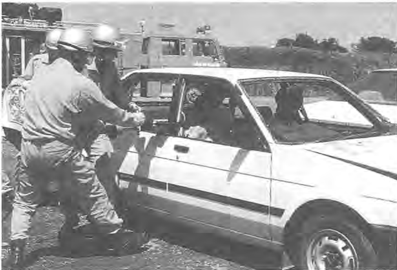
本番さながらの人命救助 (昨年の総合防災訓練から)

この訓練は、首都圏七都県市(千葉県・東京都・神奈川県・埼玉県・千葉県・横濱市・川崎市)の合同防災訓練の一つとして行われる予定です。