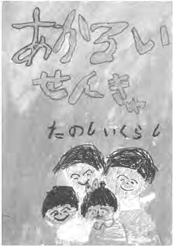
平成3年度明るい選挙啓発ポスター入選 旭小学校3年 鳥 彰孝くんの作品

わたしたちは、豊かな緑と水をまもり、潤いのある住みよい柏をつくるためにこの憲章を定めます。 1 たがいに話し合っ、心のかよう明るい柏をつくりましょう 1 老人を敬い子どもを愛する、あたたかい柏をつくりましょう 1 環境をととのえ、安全できれいなまち・柏をつくりましょう 1 教育を重んじ、健康で、文化の薫り高い柏をつくりましょう 1 国際理解を深め、平和な柏をつくりましょう