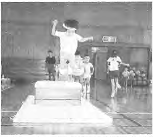
それっ、ジャンプ (昨年の同体操教室から)

明るく健康で、心豊かな子 歳児の親子を対象に、幼児体 どもの育成を目指し、四・五 操教室を開きます。