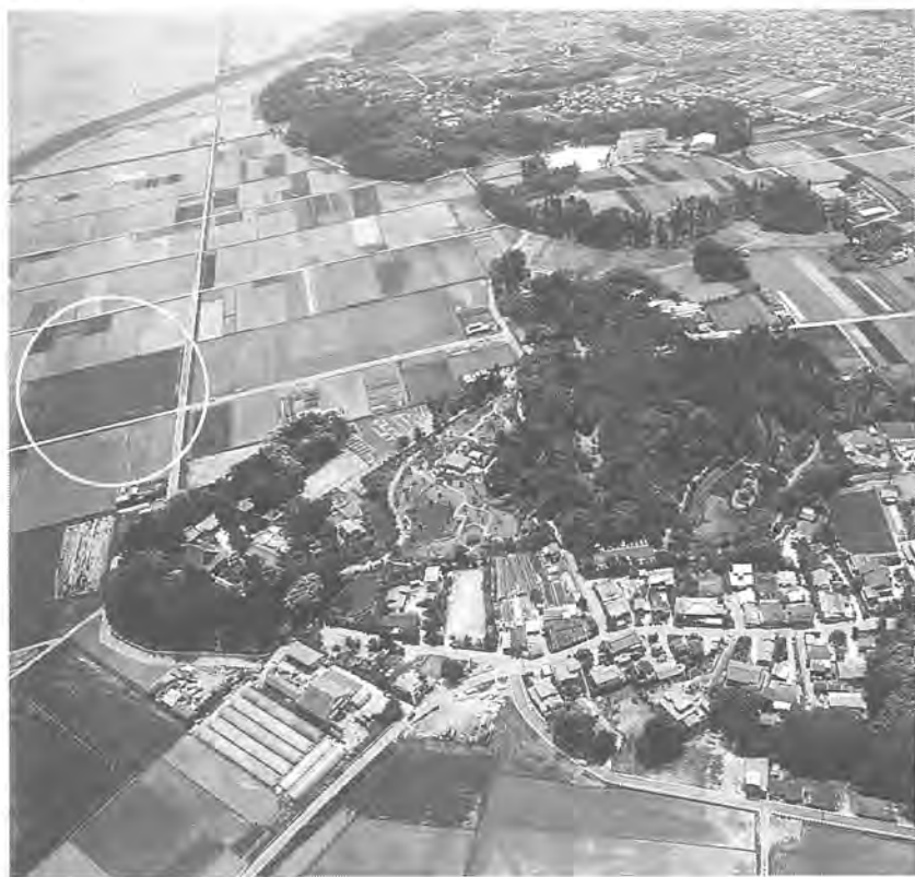
整備が進められるあけぼの山周辺。円内が「ふるさと農園」(昨年5月に撮影)