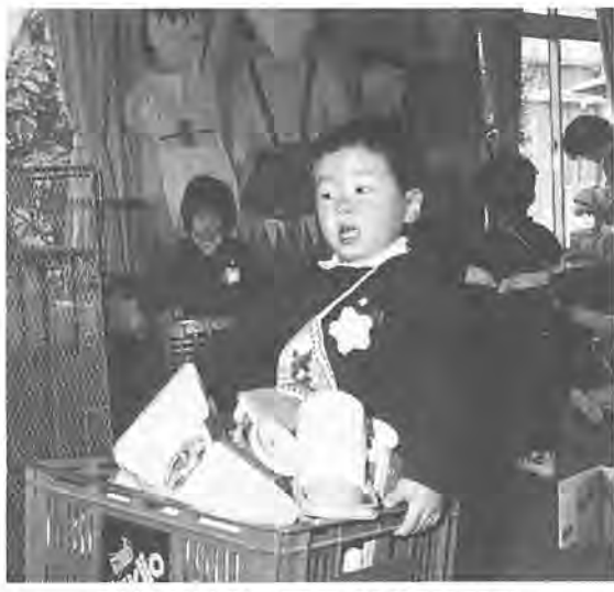
後片づけだって自分でできます

幼稚園への入園準備に、幼稚園に入るに、幼児ルームの入所を募集します。 対象 市内在住で、昭和63年4月2日から平成元年4月1日までに生まれた、集団生活が可能なお子さん。保育期間 四月からの一年間、おむね七日に一回の登園となります。(八月は夏休み) 申し込み 2月17日(月)・18日(火)午前9時半～午後3時に保護者のかたがお子さんを同伴し、入所を希望する 豊四季幼児ルーム (豊四季台婦人児童センター内) 交通・豊四季台団地循環バス 「住宅西口」下車 徒歩五分 豊住幼児ルーム (社会福祉センター内) 交通・新柏駅下車 徒歩四分