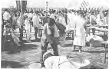
昨年の研修センターのまつり

市内特産の野菜の即売をはじめ、もちつき大会や各種模擬店など、内容は盛りだくさん。ぜひお出かけください。 農業研修センター(布施二) ○10月27日(日) 午前10時～午後3時 内容 野菜や草花の即売・野菜の収穫体験・もちつきなど ・大巻きずし作り・焼き芋作り ・紅白もちの無料配布など 田中農協(大室一〇九五) 31-255-9 とき 11月3日(日) 午前9時～午後3時 内容 野菜の即売・バザー・もちつき・ゲートボール大会など 柏市農協(柏一丁目四一) 64-115-92