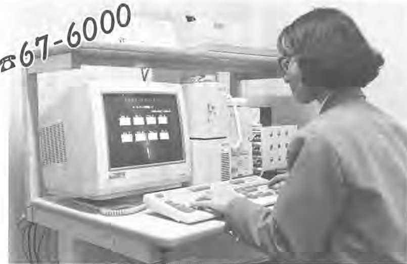
テレホンガイドの本体。新しい情報も随時登録し提供します

「テレホンガイドかしわ」には、住民登録・国民年金・市税などの届け出や手続き等百九十項目の情報が登録されています。主な内容は次のとおりです(広報かしわ十月二十一日号と、いっしょにお配りした「テレホンガイドかしわ・コード表」を参照)。