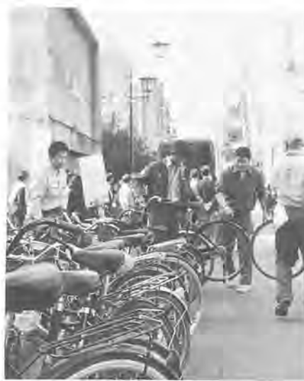
移送される放置自転車

首都圏の六都県市では、十月二十八日から十一月二日まで、「放置自転車」をスロトなどを配って、歩行者や車の通行の妨げとなる自転車の迷惑駐車をしないよう、市民迷惑防止キャンペーンを実施します。