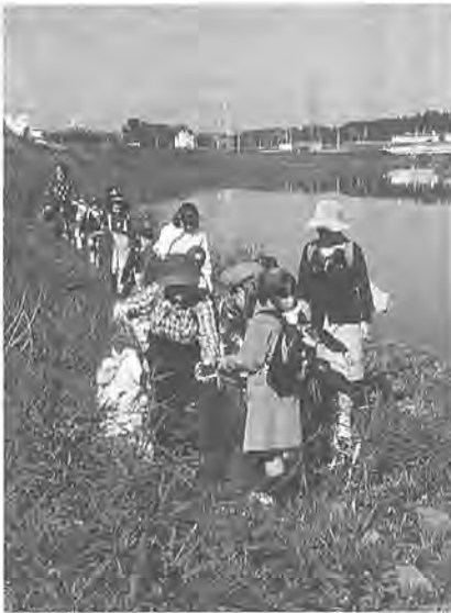
みんなで歩くのは楽しいよ