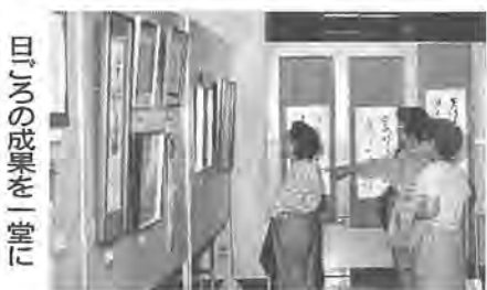
「公民館まつり」が開かれま す。日ごろ、中央公民館で活 動しているサークルが、学習 の成果を発表します。今回の テーマは「創る喜び 学ぶ喜 び」です。観覧は無料です。

の成果を発表します。今回の テーマは「創る喜び 学ぶ喜 び」です。観覧は無料です。