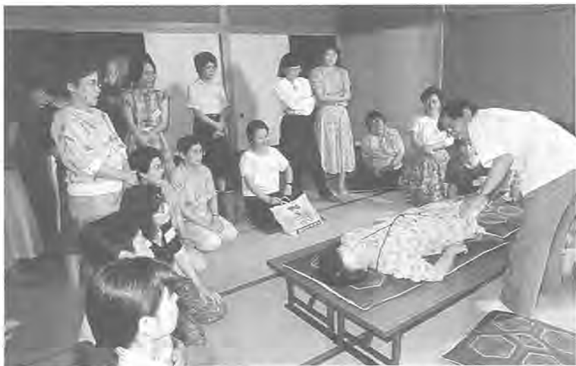
あなたの力を福祉に生かして -ホームヘルプ講座から-

二年には高齢化率(六十五歳以上の人口比率)が、七パーセントに達しました。これは国際連合が定義した「高齢化社会」へ、柏市が移行したことを示しています。