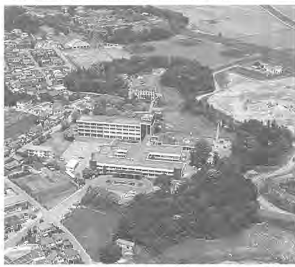
国立柏病院跡地を保健・医療・福祉の拠点に

八月二十三日、柏市は「平成三年度ふるさと健康長寿のまちづくり事業」の指定の内示を、国から受けました。この事業は、高齢化社会に向けて、高齢者が生きがいを持ち、健康で安らかな生活を営むことができる地域社会の形成促進を目的として、平成元年度から、厚生省が実施している事業です。