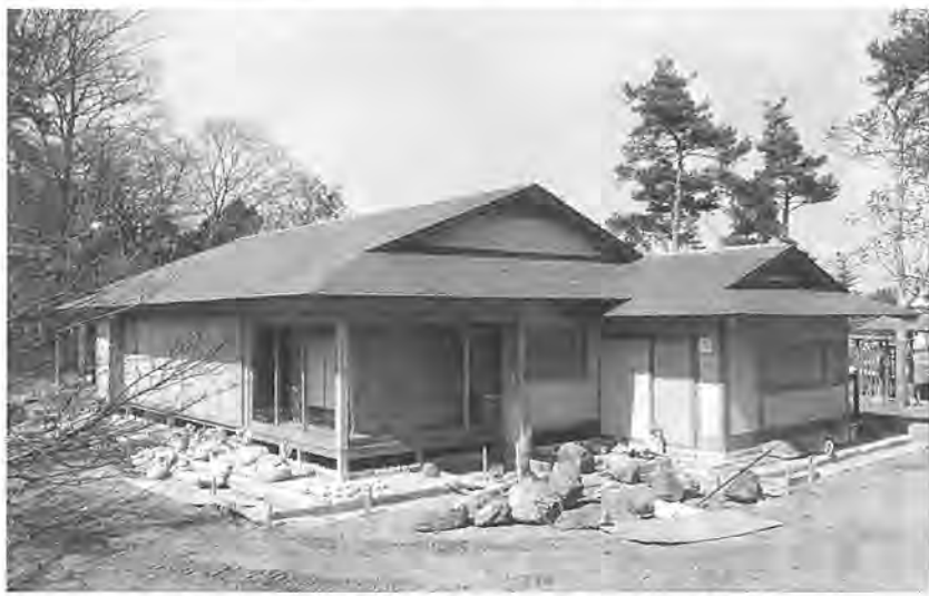
まもなくオープンするあけぼの山公園の茶室

平成三年度の予算案は、一七億二千万円、国民健康保険一般会計予算が平成二年度当初事業など七つの特別会計三百三十一億一千九百七十七万七千七百七十七円と、水道